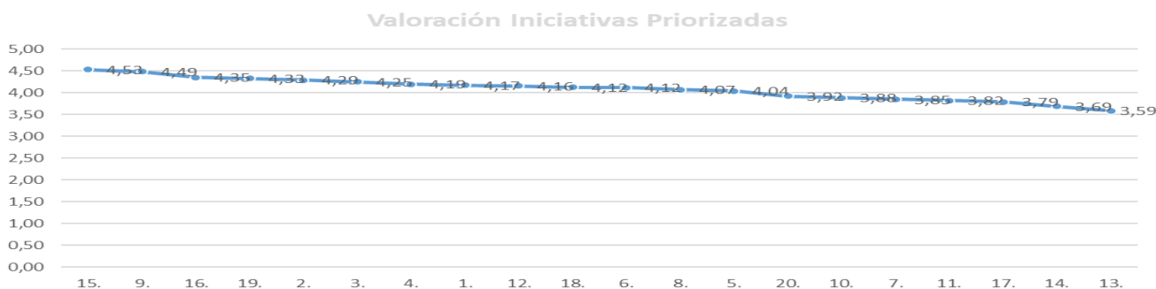
Gráfico 1: Puntuación iniciativa priorizada