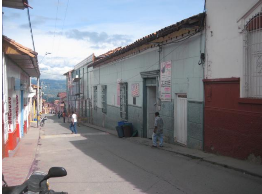
Planta física del colegio José María Villa.

Departamento de Antioquia – Municipio de Sopetrán - Alcaldía – Nit 890.981.080 - 7