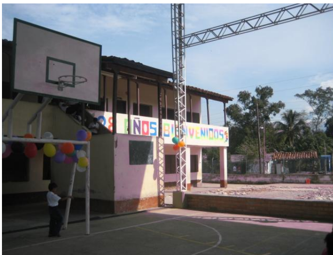
Planta física de la concentración el Rodeo.

Departamento de Antioquia – Municipio de Sopetrán - Alcaldía – Nit 890.981.080 - 7