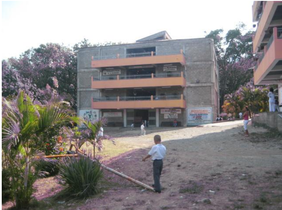
Planta física de la Normal Santa Teresita.

Departamento de Antioquia – Municipio de Sopetrán - Alcaldía – Nit 890.981.080 - 7