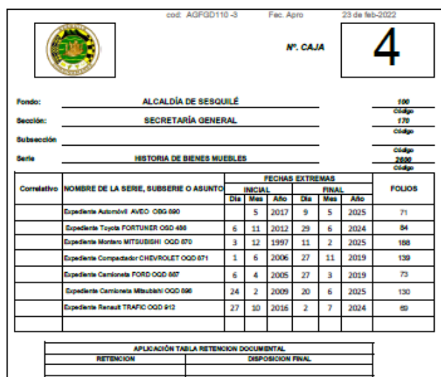
Tabla de Retención Documental Actualizada