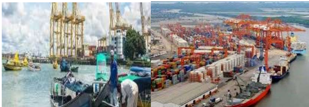
Actividad Económica de la población del Distrito