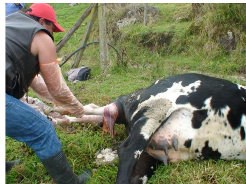
PARTO DISTOCICO BOVINO