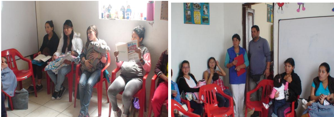
CAPACITACION HUERTAS CASERAS GRUPOS MADRES FAMY

El objetivo del programa fue implementar huertas caseras en los predios de familias campesinas del municipio como apoyo al programa de Seguridad Alimentaria, con el fin de fortalecer las actividades pedagógicas y productivas encaminadas a brindar una mejor calidad de vida. Así mismo, se pretendió desarrollar una producción agroecológica que permitiera el autoconsumo de las familias. Además se trató de fomentar la seguridad alimentaria en las familias rurales para contribuir con su bienestar. También se brindó asesoría y asistencia técnica para un adecuado desarrollo de las huertas.