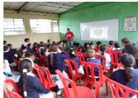
ETAPA DE CAPACITACION HUERTAS ESCOLARES