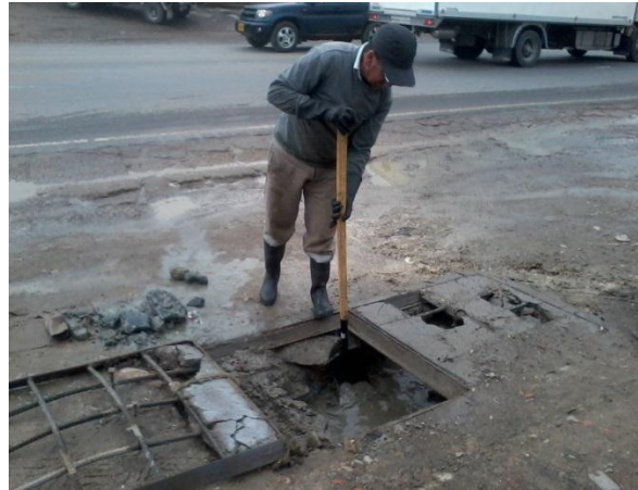
Mantenimientos cajas de inspección Vereda San Raimundo Centro Poblado