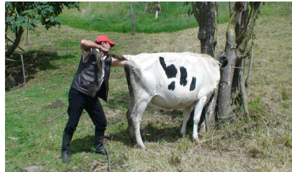
DETECCIÓN DE CELO