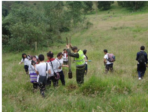
CAMINATA Y JORNADA DE REFORESTACION- LAGUNA VERDE

Con el objetivo de promover cultura ambiental en los estudiantes de las Instituciones Escolares del Municipio, se desarrollaron dos caminatas ecológicas junto con jornadas de reforestación, la primera en uno de los predios de reserva hídrica más importantes del Municipio denominado Laguna Verde y otra en la Planta de Tratamiento de Aguas Residuales del Municipio.