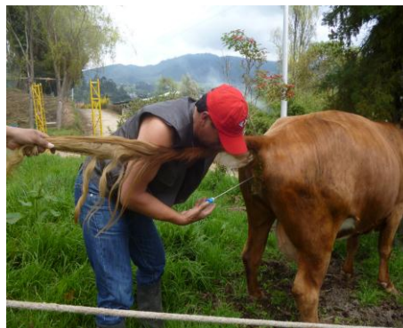
PRACTICA DE INSEMINACIÓN