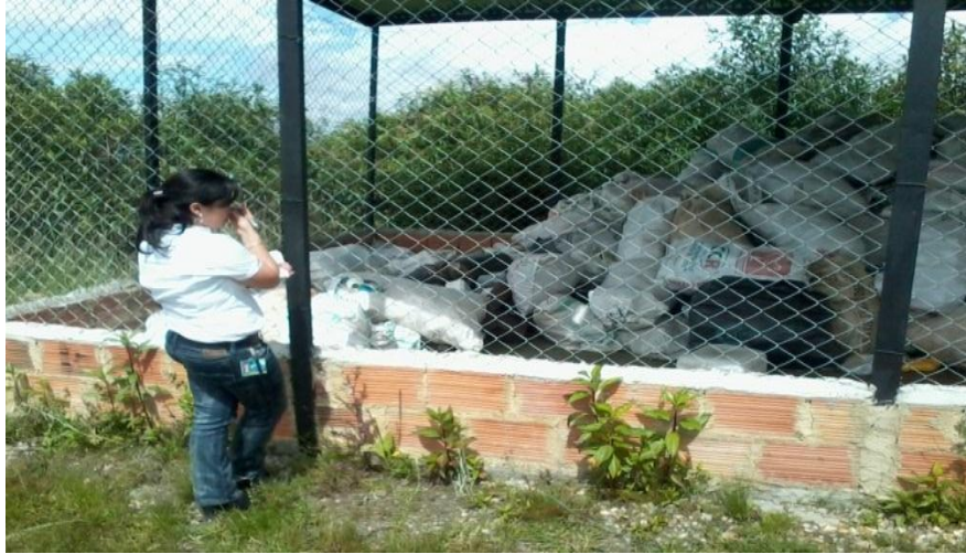
Visita de verificación predio San Joaquín por parte de la CAR