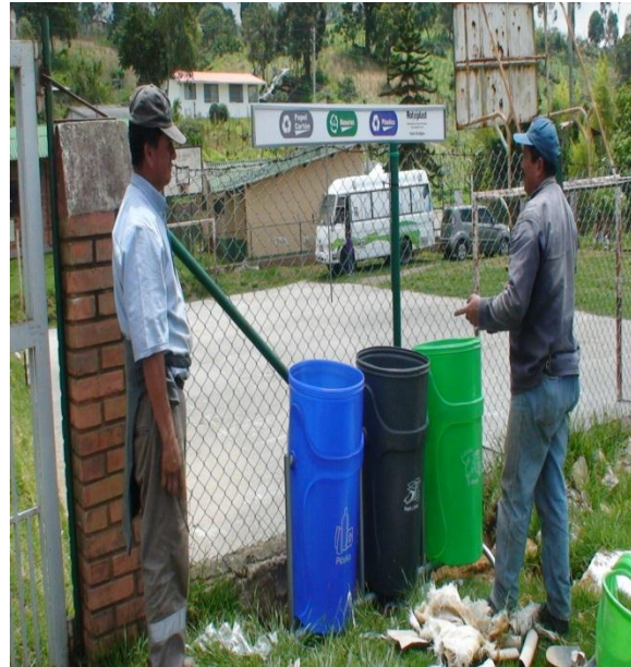
Instalación kits de reciclaje casco urbano Vereda Venecia, Vereda Carrizal, escuela San Raimundo

En atención a los requerimientos de recolección y manejo de residuos sólidos la Administración Municipal apropio los recursos necesarios para contratar a 4 operarios los cuales cumplen las funciones de barrido y recolección de basuras en el sector Urbano y en el área rural estableciendo para ello un cronograma y ruteo a fin de realizar una rutina de limpieza de los diferentes sectores del Municipio.