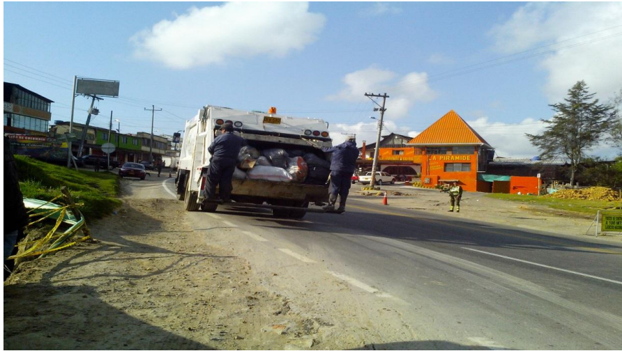
Recolección de Residuos Sólidos Vehiculó Compactador Centro Poblado