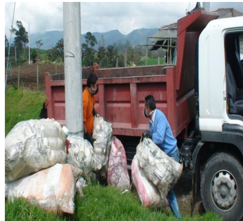
RECOLECCION ENVASES DE AGROQUIMICOS