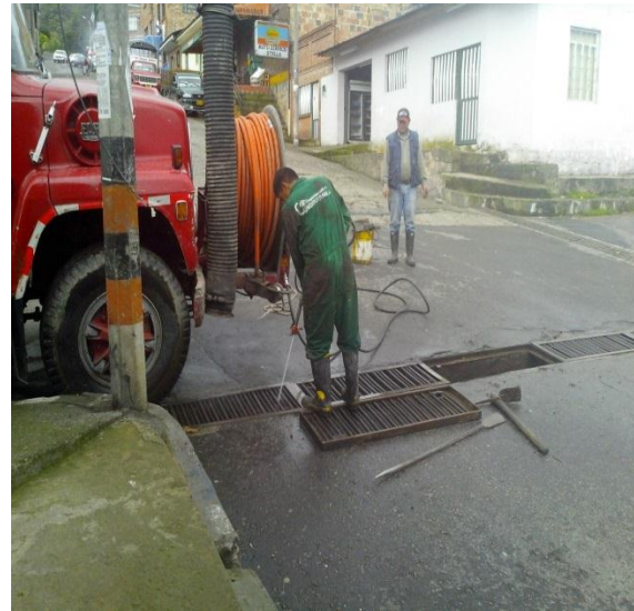
Vehiculó Bactor realizando la limpieza de cajas y sumideros vía Plaza de toros sector urbano