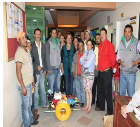
AMUC (Asociación Municipal de Usuarios Campesinos)