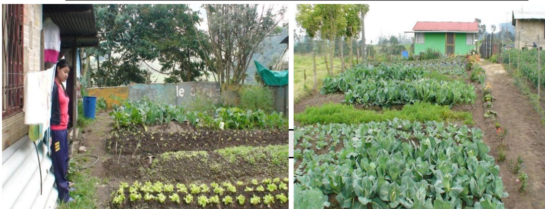
HUERTAS IMPLEMENTADAS - SECTOR RURAL