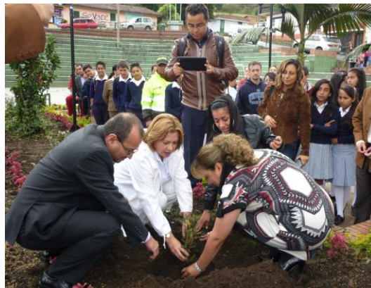
ACTOS PROTOCOLARIOS Y SIEMBRA SIMBOLICA BICENTENARIO