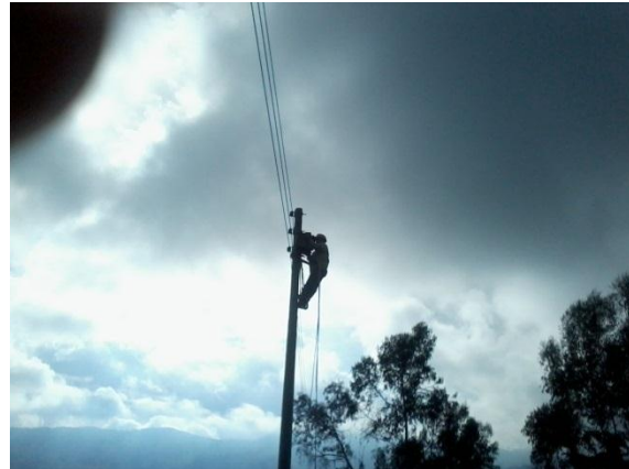
Mantenimiento y reposición luminarias

Las dificultades en la prestación de este servicio están en que la administración municipal ha tenido que apropiarse recursos para cubrir el faltante que por concepto de cartera vencida se adeuda, la cual asciende a los $ 10.732.020 por concepto de alumbrado público por lo que se viene adelantando una campaña de cobro persuasivo con la finalidad del que el usuario se ponga al día en materia de este importante servicio.