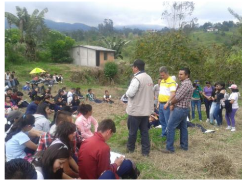
CAMINATA Y JORNADA DE REFORESTACION PTAR MUNICIPAL