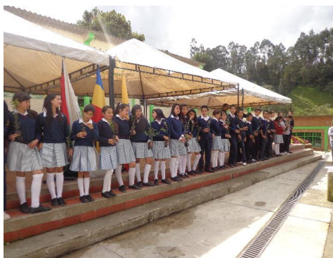
ACTOS PROTOCOLARIOS Y SIEMBRA DE ARBOLES GRUPO QUERCUS