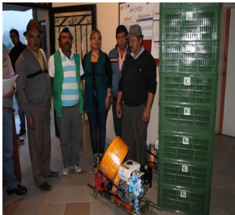
ASOAGRA (Asociación de Productores

De acuerdo al Convenio 073 de 2012 suscrito entre la Secretaria de Competitividad y Desarrollo Económico y la Administración Municipal, cuyo objetivo fue fortalecer 4 Asociaciones Empresariales del Municipio; el noviembre de 2013 se cumplió con la entrega de maquinaria objeto del Convenio a las siguientes asociaciones: ASOAGRA (Asociación de Productores de Granada), AMUC (Asociación de Municipal de Usuarios Campesinos), ASOESTIN (Asociación Estilo Infinito) y ASAMIP (Asociación Artesanal de Mi Pueblo).