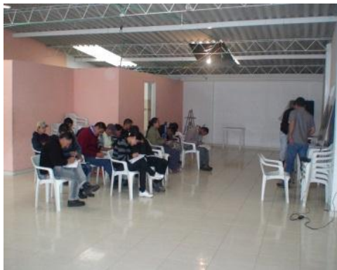
CURSO DE INSEMINACIÓN BOVINA

Durante el 2013 se realizaron capacitaciones como Capacitación en Brucelosis y Tuberculosis Bovina, Socialización sobre certificación de predios libres de Brucella y Tuberculosis, Curso de Inseminación Artificial en Bovinos.