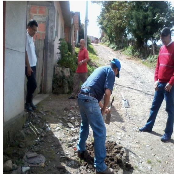
Mantenimiento y limpieza cajas de inspeccion sector urbano