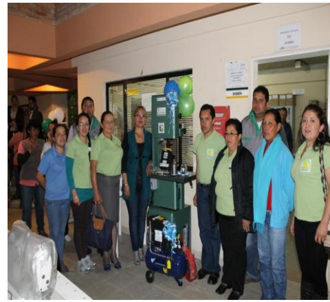
ASAMIP (Asociación Artesanal de Mi