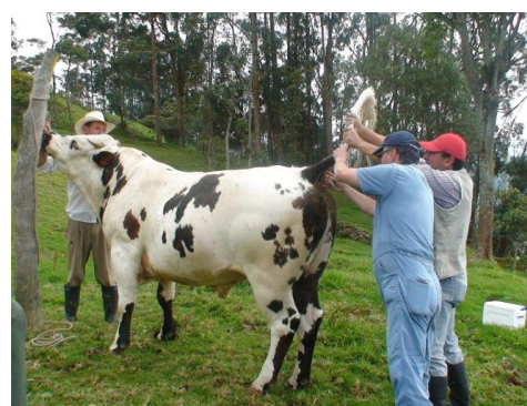
MUESTREO BRUCELLA Y TUBERCULOSIS

De igual manera se desarrollaron otras actividades como: