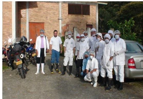
PRACTICA CURSO DE INSEMINACIÓN