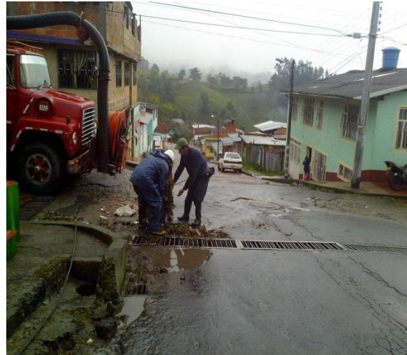
Limpieza realizada en sector Urbano Centros Poblados, vereda el Ramal