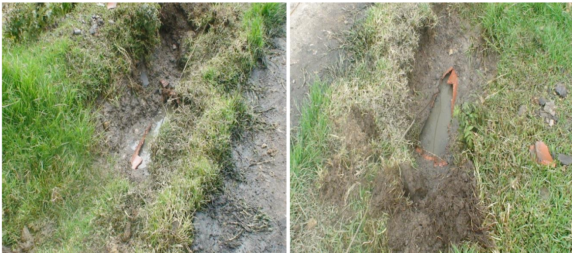
Rotura Tubería 8" Sector vía templo Hare Krisna.

Colapso tubería de 20" AN Sector Centro Poblado Barrio el Progreso y Comunidad afectada por colapso tubería de 20" AN Sector Centro Poblado Barrio el Progreso Vereda el Ramal Via Templo Hare Krisna: se realiza la rehabilitacion de un tramo de 86 ml en tubería de Novaford de 8" para alcantarillado sanitario.