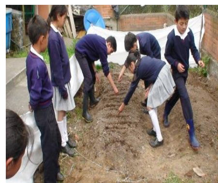
ETAPA DE IMPLEMENTACION HUERTAS ESCOLARES