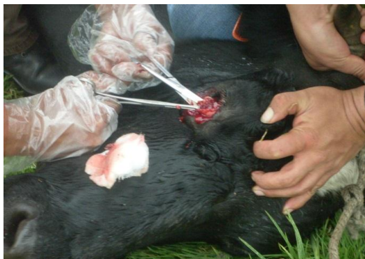
COMPLEJO OCULAR BOVINO (COB)