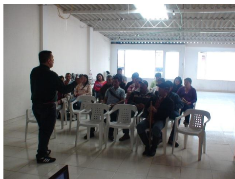
CURSO DE BRUCELLA Y TUBERCULOSIS