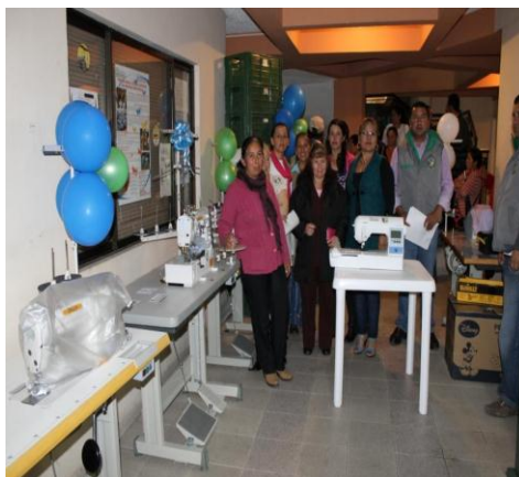
ASOESTIN (Asociación Estilo