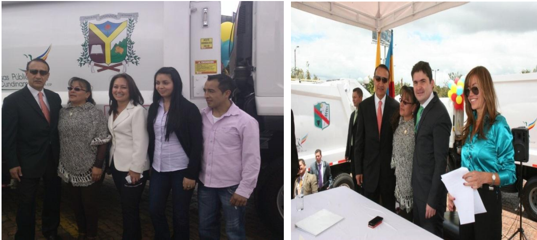
Entrega Vehiculó Compactador mes de Septiembre de 2013.

gestión realizada ante Empresas Publicas de Cundinamarca, por la Alcaldesa Municipal, con el cual se ha venido mejorando la calidad en la prestación del servicio y se pretende ampliar la cobertura de recolección y frecuencia tanto en el área urbana como en la rural. Este vehículo entró en servicio en el mes de Octubre del año 2013 y opera con normalidad garantizando una recolección más óptima de basuras y con menos impacto ambiental en los recorridos.