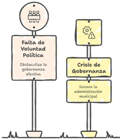
Imagen 1: Análisis de las deficiencias de la gobernanza para la paz en el municipio de Puerto Berrío

La carencia de iniciativa por parte de las organizaciones sociales y comunitarias para participar activamente se origina en la desconfianza, factor que inhibe su involucramiento efectivo en los asuntos públicos. Adicionalmente, la ausencia de espacios de participación ciudadana efectivos obstaculiza un correcto ejercicio de gobernanza en el municipio; si la administración municipal omite crear mecanismos y establecer garantías para que la ciudadanía pueda expresar sus opiniones e incidir en la toma de decisiones, se reduce drásticamente la legitimidad y la eficacia de los espacios de colaboración colectiva, como el Consejo Local de Paz.