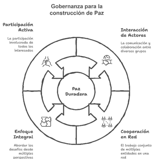
Imagen 2: Gobernanza para la construcción de paz en Puerto Berrío