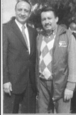
ÁLVARO CRUZ Gobernador

Porque dada la difícil situación financiera de nuestro municipio, ofrezco mi experiencia administrativa y mi capacidad de gestionar recursos para acudir allí donde quedaron los amigos, en la Gobernación de Cundinamarca, en el Gobierno Nacional, en el Congreso, a gestionar y conseguir recursos para atender tantas necesidades que hoy tenemos en nuestro municipio.