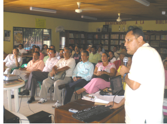
Mesa de trabajo Mipio la Jagua del Pilar (ENERO/08)