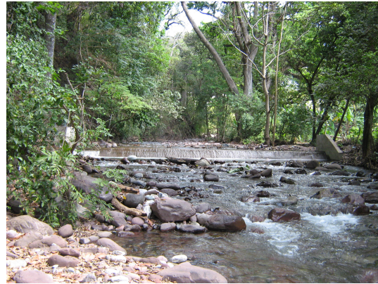
Sitio de captación acueducto municipal Río Marquezote

Para el desarrollo de la hidrografía se trabajo con base en el concepto de cuencas hidrográficas que constituyen la unidad espacial natural de su planificación territorial.