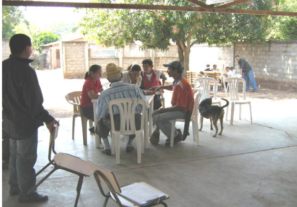
Mesa de trabajo en el Cgto del Plan (Febrero/2008)