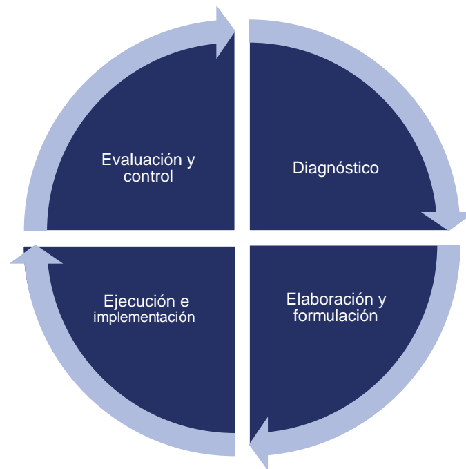
Etapas de la participación ciudadana