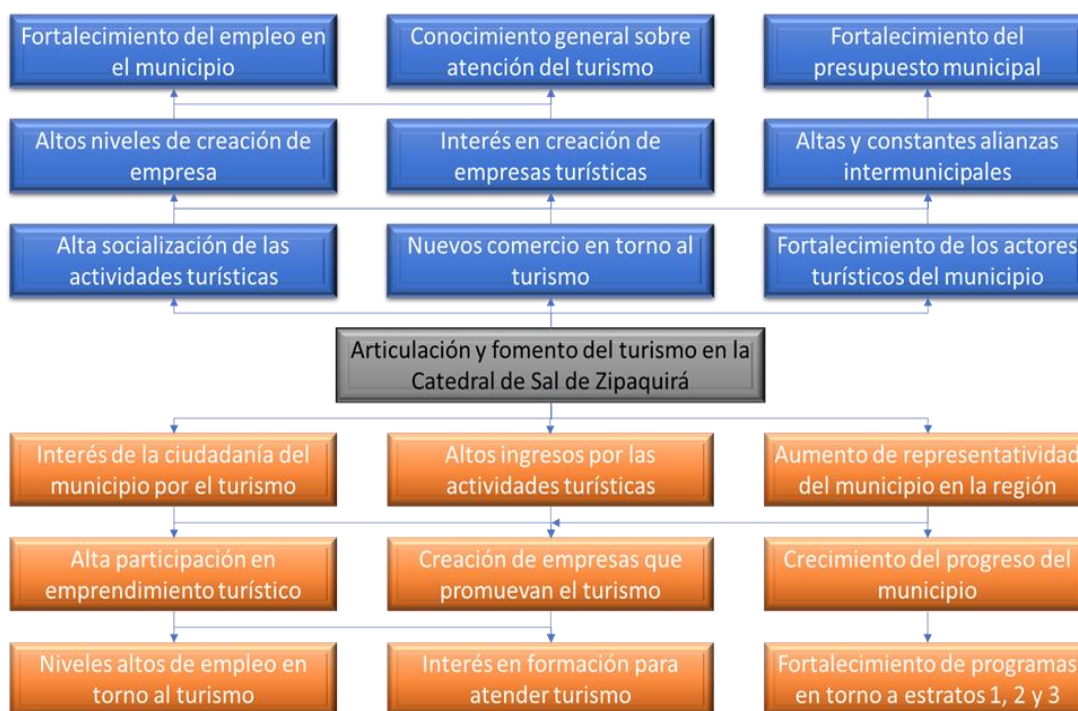
Ilustración 2 Árbol de objetivos del turismo sostenible en Zipaquirá

Fuente: Elaboración propia (2025), con base en el método de Marco Lógico.