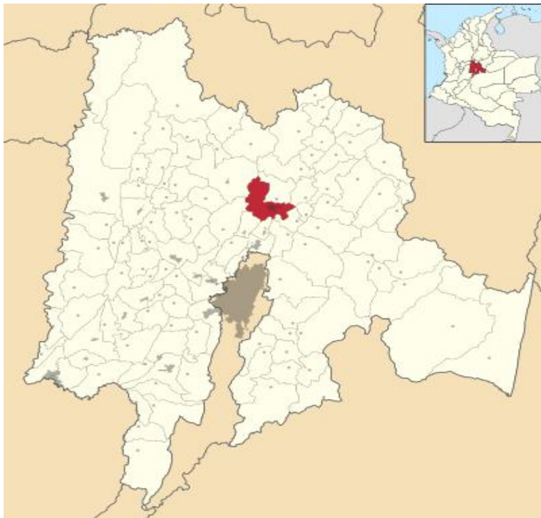
Ilustración 1. Georreferenciación del municipio de Zipaquirá