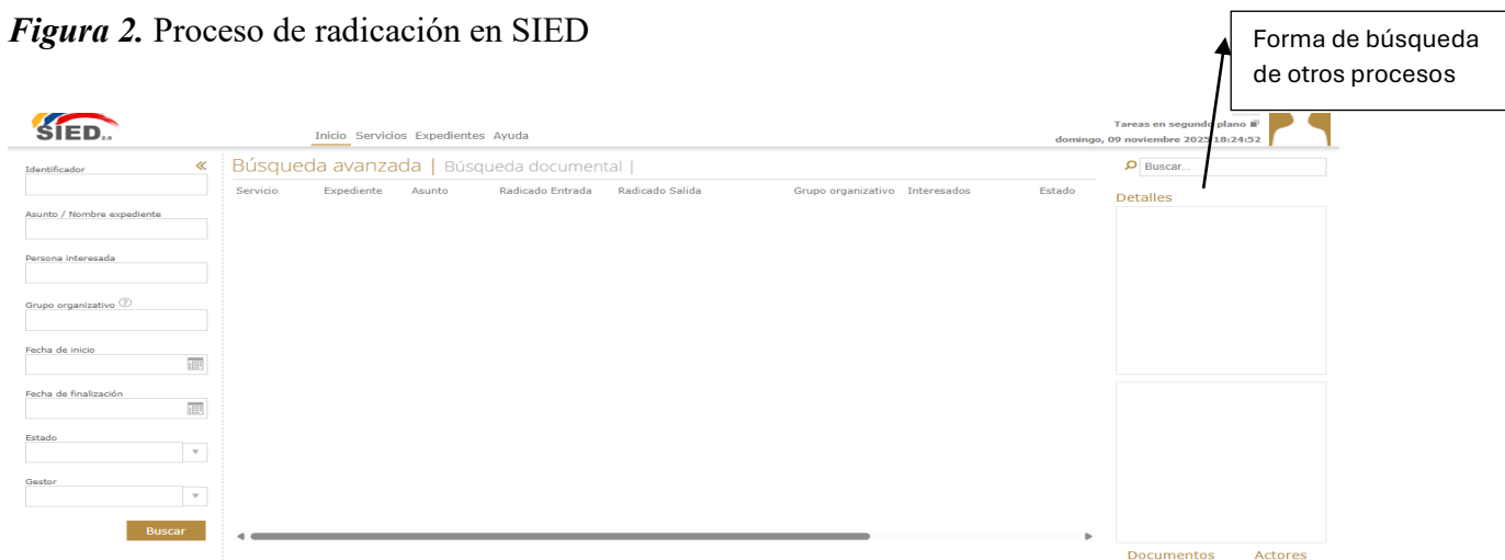
Figura 2. Proceso de radicación en SIED