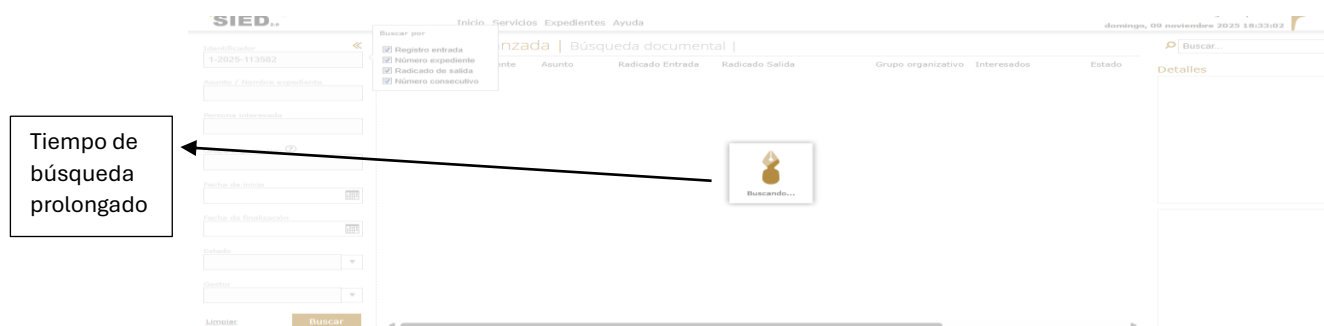
Figura 4. Mensaje de error por intermitencia del sistema SIED