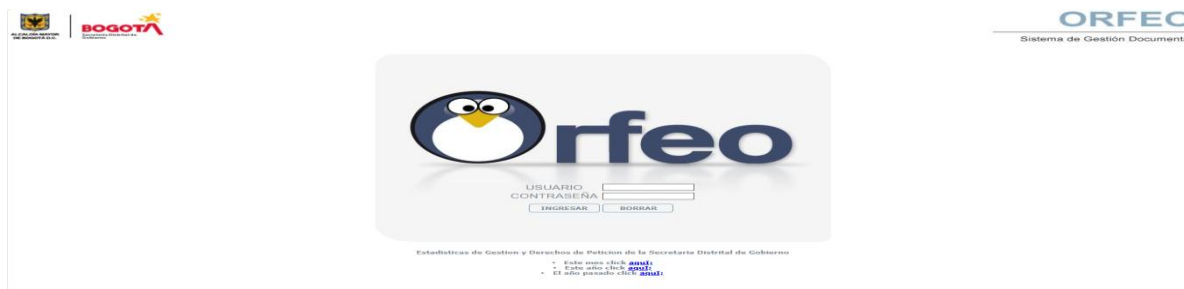
Figura 5. Interfaz del sistema ORFEO