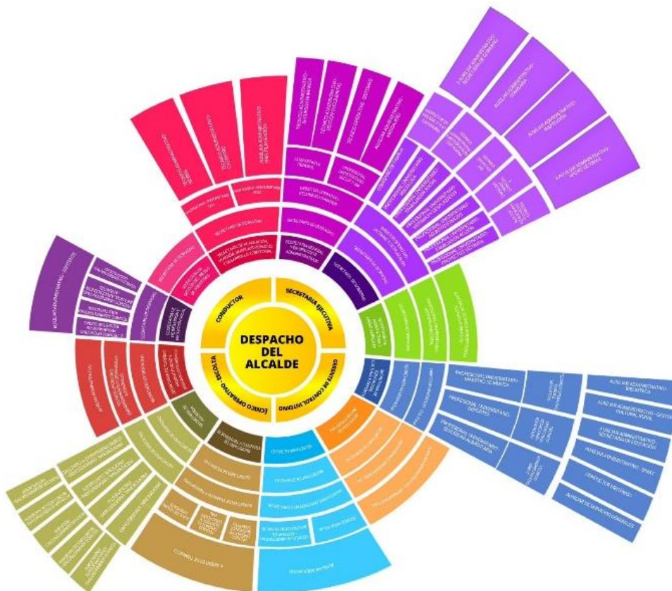
Organigrama Alcaldía de Necoclí