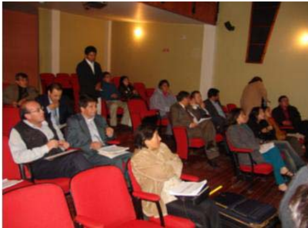
Socialización Plan de Desarrollo ante el COMPIS

El Plan de Desarrollo “Ipiales merece lo mejor” en la parte del Plan Plurianual de Inversiones, sigue lineamientos de Planeación Nacional y se ha estructurado de acuerdo a la ley 715, es decir, contiene componentes como sector educación, salud y propósito general, con una proyección a cuatro (4) años, integrando la parte urbana y rural, con la finalidad de que cada vigencia fiscal, tome como base el presupuesto de inversión del Plan Plurianual correspondiente a cada año y se logre dar ejecución a la inversión ya que solo a través del presupuesto municipal se puede dar ejecución al Plan de Desarrollo del Municipio.