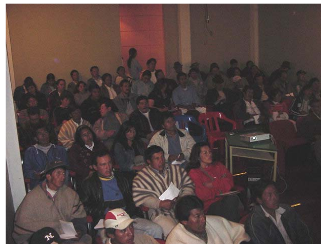
Socialización Plan de Desarrollo Sector Rural