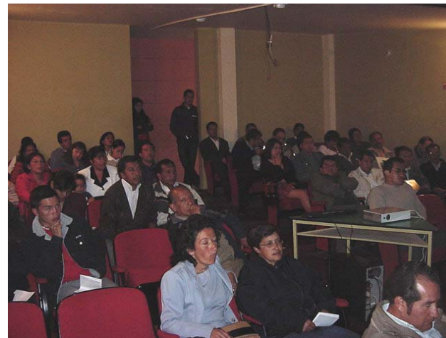
Socialización Plan de Desarrollo Sector Urbano

representativa a través del Consejo Territorial de Planeación (COMPIS) y del Concejo Municipal.