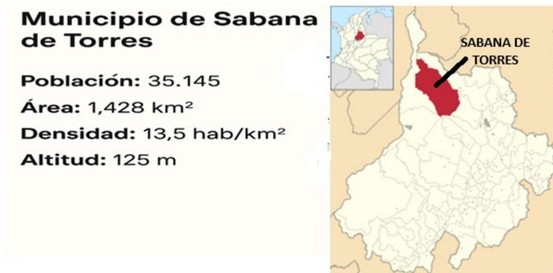
Ilustración 1: Ubicación Geográfica Municipio de Sabana de Torres