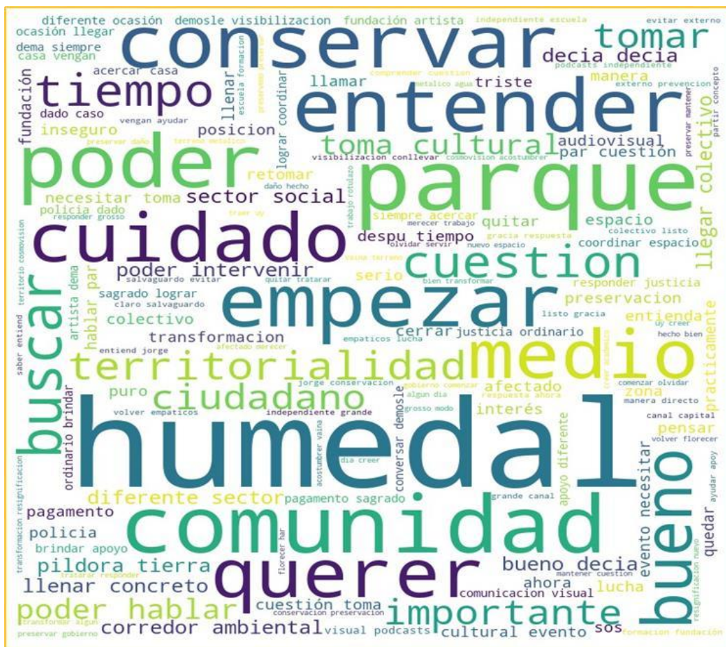
Imagen 8. ¿Considera que las leyes, especialmente el Decreto 565 del 2017, han tenido un impacto positivo en las transformaciones socioambientales de los humedales?

La comunidad entrevistada considera crucial comprender la importancia de conservar el territorio y cómo las políticas influyen en él. El megaproyecto del corredor ambiental ha dejado una huella profunda en la comunidad Muisca, afectando su conexión con el territorio y su identidad territorial como otras obras alrededor de su territorio.