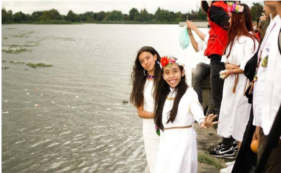
Nota: Cabildo Indígena Muisca de Suba.