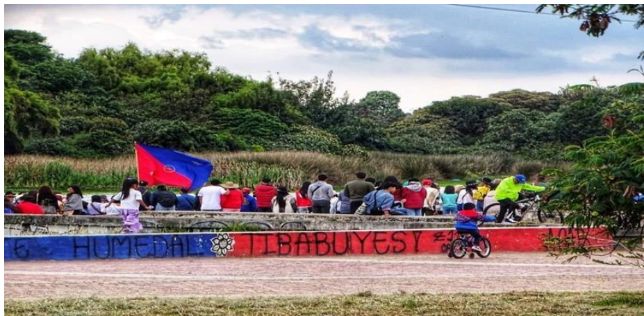
Imagen 1. Posesión de las Autoridades Indígenas. 23 de enero de 2023.

La Laguna de Tibabuyes, antes un único cuerpo de agua, ha sido fragmentada y dividida de diversas maneras a lo largo del tiempo. En este contexto, la evidencia fotográfica del periodo estudiado cobra una gran relevancia, ya que permite mostrar no solo la transformación del humedal, sino también el papel diario que la comunidad Muisca desempeña en la configuración cultural y cosmológica del territorio.