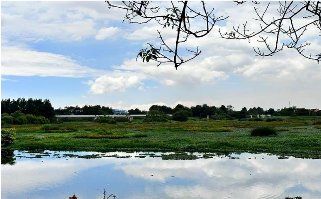
Imagen 5. Tercio Medio Bajo del humedal Tibabuyes-2023.