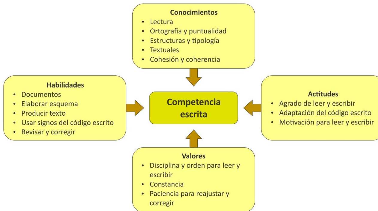
Figura 2. Dominios de la competencia escrita