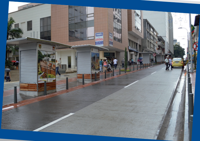
Calle de la Fundación Pereira. Calle 19 Carreras 6ª a la antigua estación del Ferrocarril de Pereira (Parque Olaya Herrera)