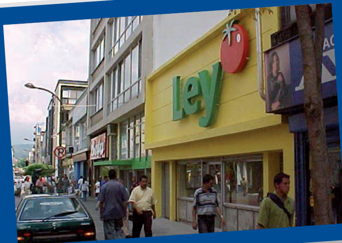
Imágenes del Espacio Público recuperado durante la alcaldía de Marta Elena Bedoya: Carrera 8ª Calles 17 a 18 Andén Sur 33