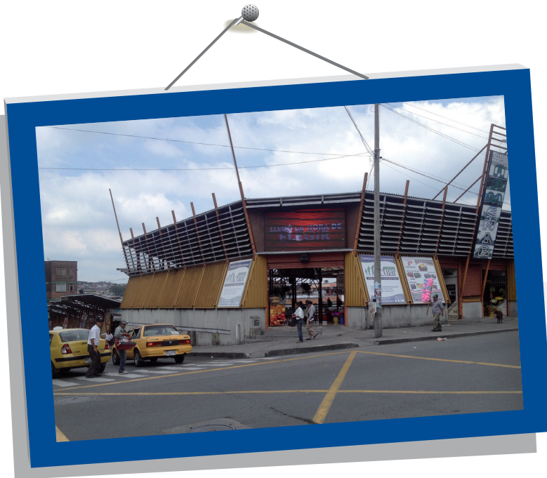
Centro Comercial Popular Armenia (ubicado entre las carreras 18 y 19, y calles 16 y 17), se reubicaron vendedores de cacharros

Las Administraciones de Armenia han ejecutado los planes de alternativas.