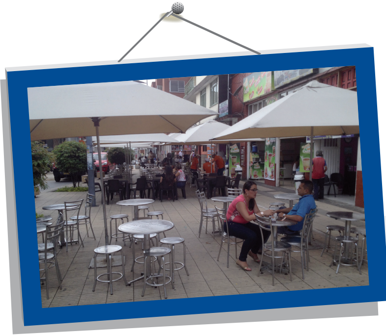
Aprovechamiento económico del espacio público en el Parque Sucre de Armenia