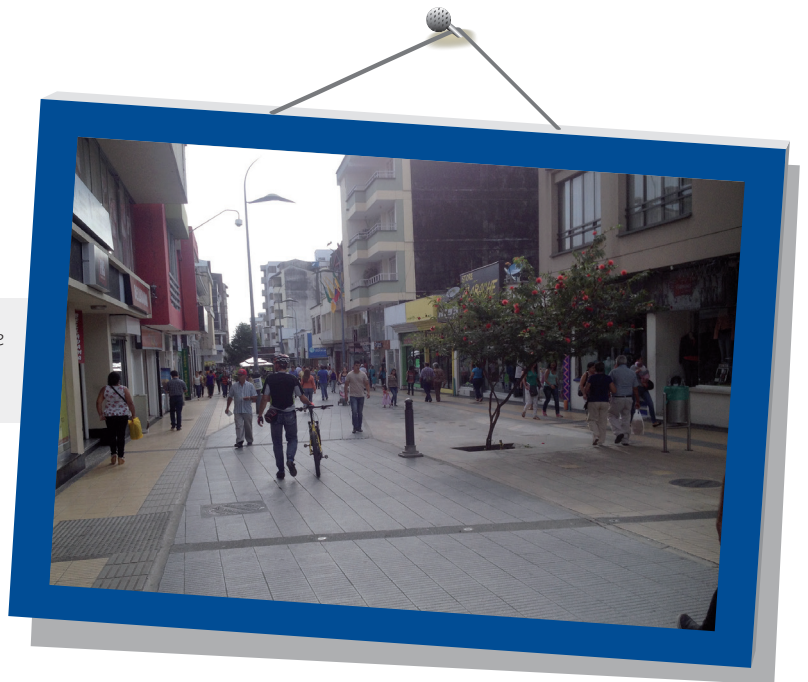
Centro Comercial Cielos Abiertos - Calle Real (Carrera 14), recuperación de espacio público