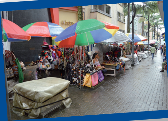
Vendedores de artesanía reubicados en Pereira. Paseo de los artesanos. Calle 18 de carreras sexta y séptima

entrega de dineros, pero posteriormente esos mismos u otros, inclusive otros de la familia han vuelto a ocupar los sitios”.