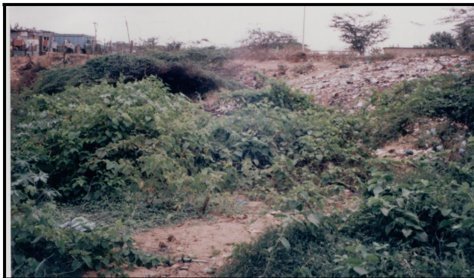
La fotografía muestra las razones por las cuales se identifica al arroyo Parrantial como un área de recuperación y mejoramiento hídrico.