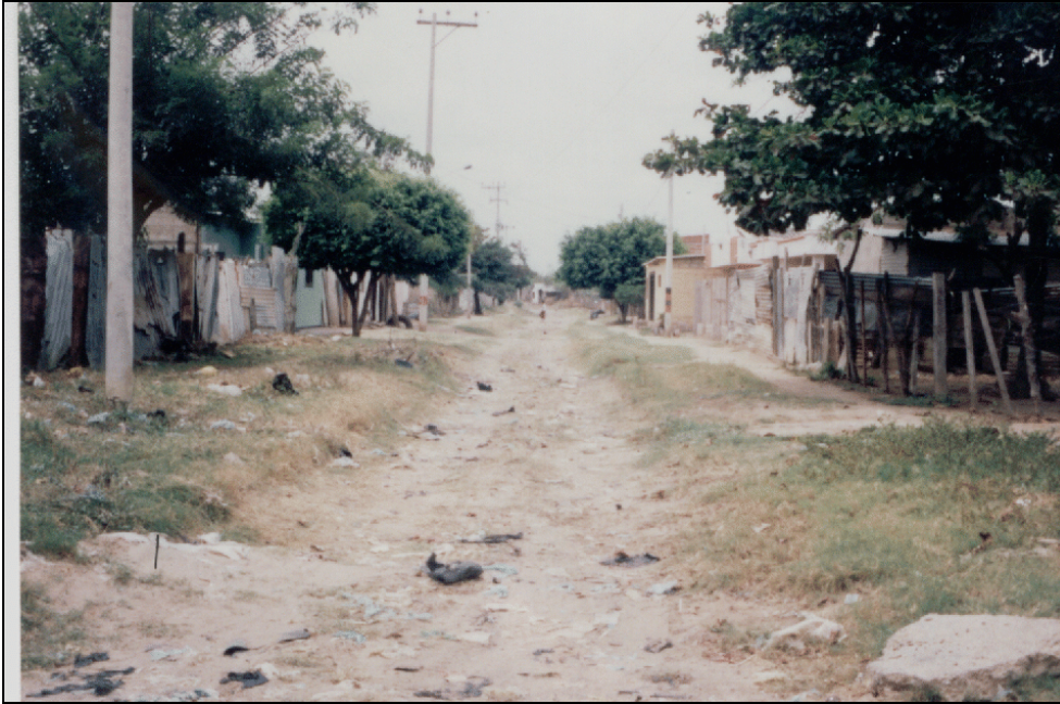
Condiciones actualmente reinantes en uno de los tramos del arroyo Majupay, en el barrio de su mismo nombre y donde se plantean actividades encaminadas a su recuperación y mejoramiento.