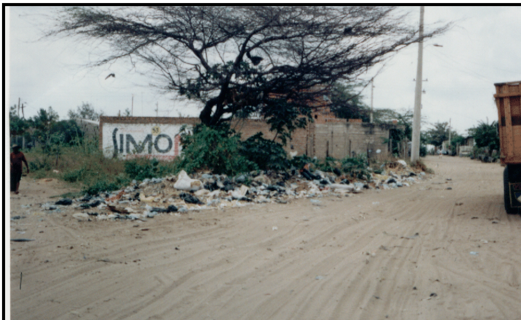
Así como éste botadero clandestino, la existencia de muchos como éste en la zona urbana es bastante común.