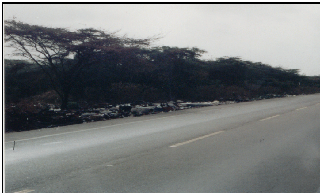
La fotografía muestra uno de los basureros encontrados en la carretera que comunica a Maicao con Riohacha, a escasos 2 kilómetros de la zona urbana.