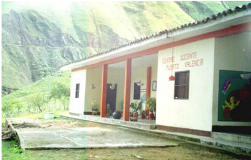
Centro Docente Puerto Valencia

Puerto Valencia cuenta con ciertas condiciones que lo hacen interesante para transformarlo e un polo atractivo para el esparcimiento municipal y regional, además presenta valores agregados como vestigios arquitectónicos que pueden enriquecer el patrimonio arquitectónico municipal, cerros tutelares de formas agradables, el río Páez en sus inmediaciones y el parque central con una escultura natural muy atractiva como lo es el samán; estos elementos representan la riqueza paisajística y ambiental de Puerto Valencia, además en complemento con la ubicación estratégica lo hacen un área de gran interés al que se le debe dar la real dimensión e importancia que merece.