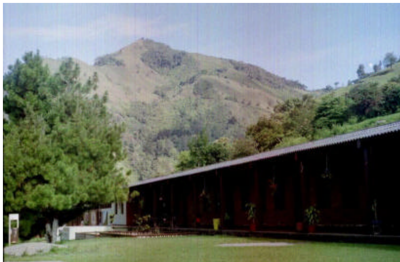
Escuela Rural Mixta Carmen de Viborá

Como población espontánea Carmen de Viborá no cuenta con áreas verdes acondicionadas ni equipamientos; el espacio central acondicionado con una cancha múltiple es el nodo de actividad principal con la cancha de fútbol. Dentro de los elementos de referencia (hitos) se destacan el Centro docente de Viborá y el cementerio.