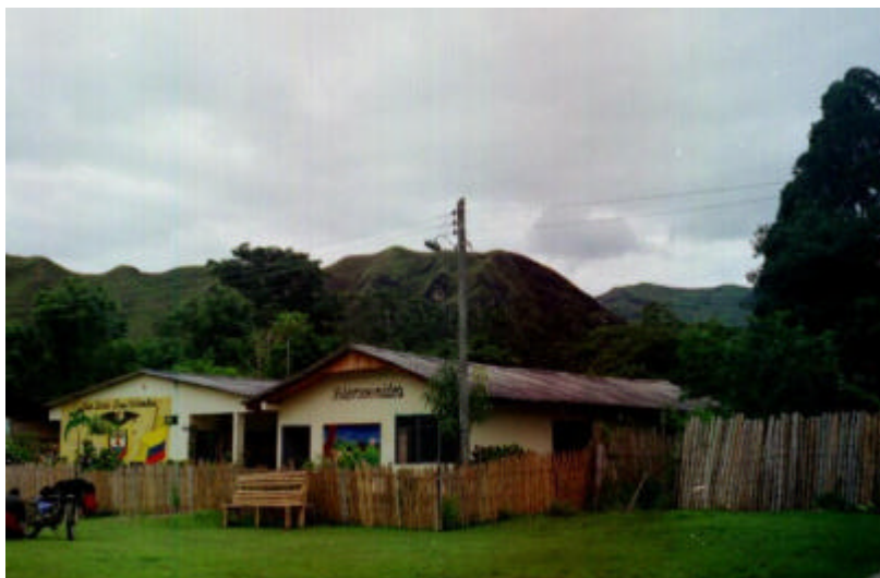
Escuela Rural Mixta Segovia

Segovia tiene como particularidad una vía de acceso vagamente definida desde la vía intermunicipal Inzá- Belalcázar, que pasa desapercibido al tránsito vehicular.