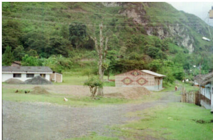
Poblado de San Francisco

El poblado de San Francisco esta ubicado a pocos minutos de la Cabecera Municipal, tiene una estructura lineal donde la vía principal es la columna vertebral, con flujo vehicular constante por ser una vía de carácter nacional.