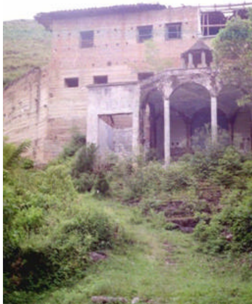
Templete – Puerto Valencia

El numero de habitantes se reduce constantemente puesto que esta población no brinda oportunidades laborales, se propicia la migración en busca de mejores expectativas de vida en otros territorios.