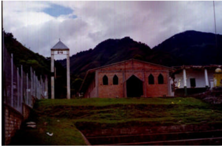
Capilla Central – Santa Teresa

Santa Teresa es un centro de congregación veredal donde se comercializan los productos agrícolas y ganaderos, igualmente se realizan actividades culturales y deportivas. Existe un comercio de abastecimiento menor al interior de la población representado en pequeños focos a manera de tiendas.