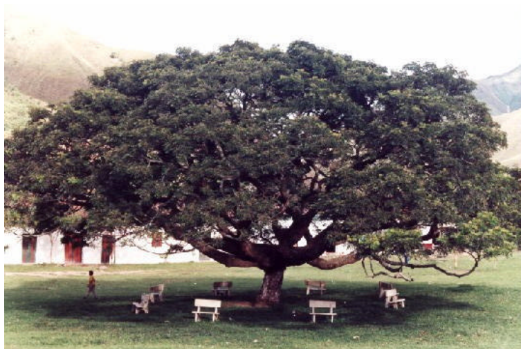
Saman parque central Puerto Valencia

En inmediaciones de Puerto Valencia existen varios cerros tutelares que son un potencial paisajístico notable. Cuenta con una estructura predial ortogonal en torno a un espacio central, actualmente una gran parte de las edificaciones que hacen parte de su paisaje original están en un alto grado de deterioro, de igual modo presenta un número reducido de habitantes en su contexto, y un número elevado de edificaciones para estos pocos habitantes.