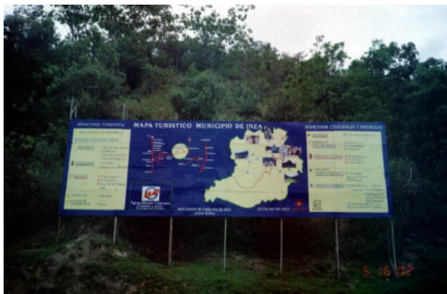
Valla Turística – Crucero de san Andrés

7.3.4.4.3 Sitios de Interés Etnoculturales y Ecoturísticos. Además del Parque Nacional Arqueológico de Tierradentro, el Municipio de Inzá cuenta con un potencial cultural, ecológico y agrológico que merecen ser protegidos y conservados. (Véase Cuadro 43 y Mapa 13 de Interés Etnocultural y Ecoturístico)