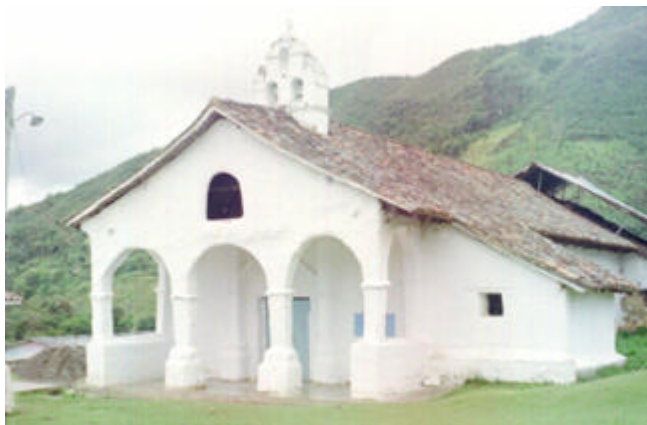
Capilla Doctrinera de Santa Roca