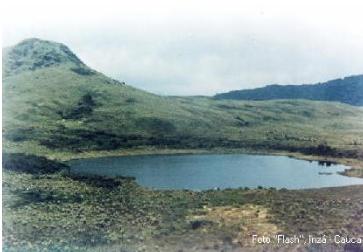
Laguna de Guanacas

- Lagunas del Páramo de Guanacas. Es uno de los sectores geográficos y ecológicos más importantes, pues nace allí el Río Ullucos, el cual constituye el cauce principal que se desplaza de occidente a oriente por todo el territorio municipal de Inzá.