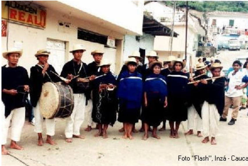
Chirimía – Resguardo de Calderas

Los grupos musicales de los Paeces no reciben un nombre propio, se distinguen con el nombre de la Vereda o Resguardo de donde provienen y están constituidos exclusivamente por indígenas.