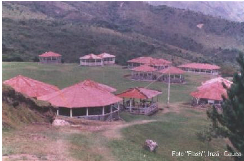
Panorámica de Hipogeos – Alto de Segovia

comparación con los otros sitios. Existen en la actualidad 25 hipogeos expuestos al público, que comprenden desde los más sencillos sin techo, hasta los más elaborados, de dos columnas centrales, siete nichos y decoración policroma.