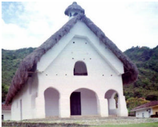
Capilla Doctrinera de San Andrés

La capilla de San Andrés es la única de las capillas doctrineras que conserva la originalidad de su construcción principalmente en su techo, cuyo material es de paja.