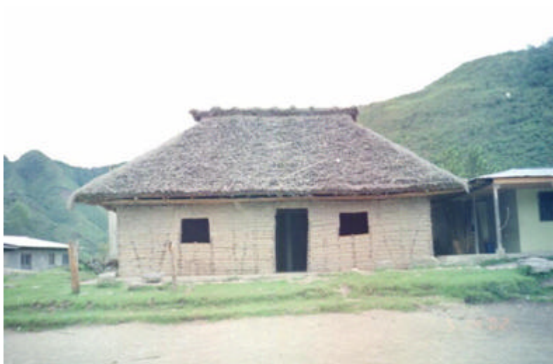
Casa del Cabildo – Resguardo de Calderas

7.3.2.2.1 El Cabildo Indígena. Es la autoridad máxima en cada parcialidad, por encima de las Juntas de Acción Comunal y de otros grupos organizados, fundaciones o corporaciones que desarrollen actividades en los Resguardos 52 . Debe “responder por la organización de la comunidad y luchar por sus intereses” de acuerdo a sus costumbres y estatutos. Está encargado de la administración económica y social de los recursos que llegan a su comunidad, y en general, de resolver los asuntos internos siempre y cuando, sus decisiones no estén en contraposición a disposiciones constitucionales.