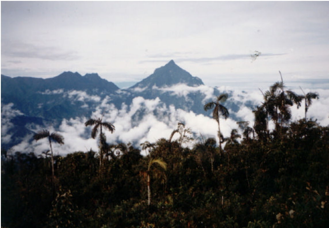
Cerro Naya. Municipio de Buenos Aires – Cauca. Geosig Ltda. 2000