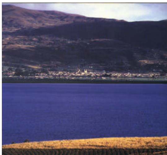
Foto 1: Panorámica del Lago de Tota. Al fondo obsérvese el casco urbano de Aquitania.

Según el estudio sobre la conservación y manejo del lago de Tota y su cuenca, realizado por Hidroestudios 1 , la conformación del lago data del mioceno y después durante la glaciación se configuraron numerosas quebradas que depositaron sedimentos cuaternarios. La cuenca se caracteriza por la formación de anticlinales y sinclinales cuyos ejes tiene un rumbo general Noreste. Estratigráficamente está constituida por rocas sedimentarias depositadas en épocas diferentes.