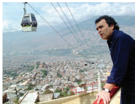
Sergio Fajardo, alcalde de Medellín

Por: Sergio Fajardo Valderrama, Alcalde de Medellín