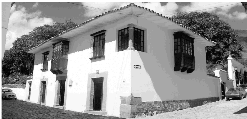
Casa del Concejo Municipal.