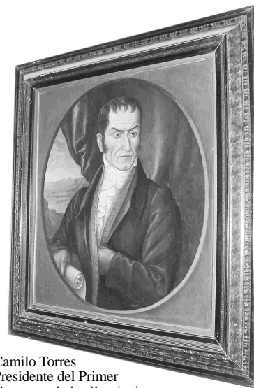
Camilo Torres Presidente del Primer Congreso de las Provincias Unidas de la Nueva Granada.

La destinación de la Casa Museo como nueva sede del Honorable Concejo Municipal de Villa de Leyva en el año de 1991, fue una decisión que convirtió al inmueble en museo vivo, toda vez que allí se desarrolla la actividad edflica de la democracia local.