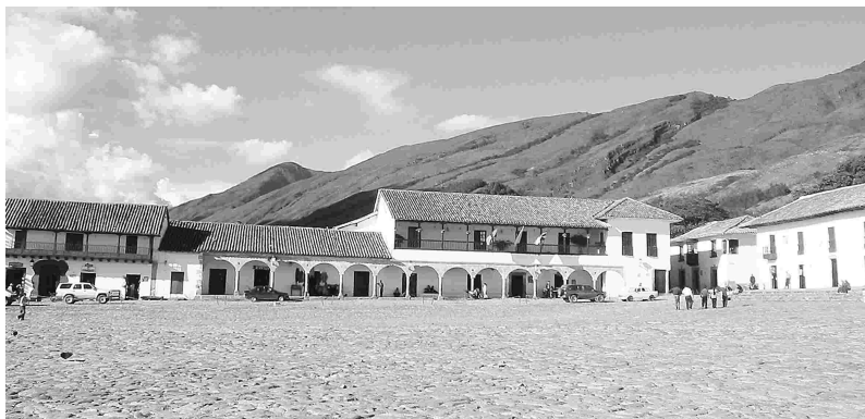
Plaza central de Villa de Leyva, con el Concejo Municipal al fondo.