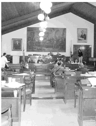
Concejo Municipal de Villa de Leyva.