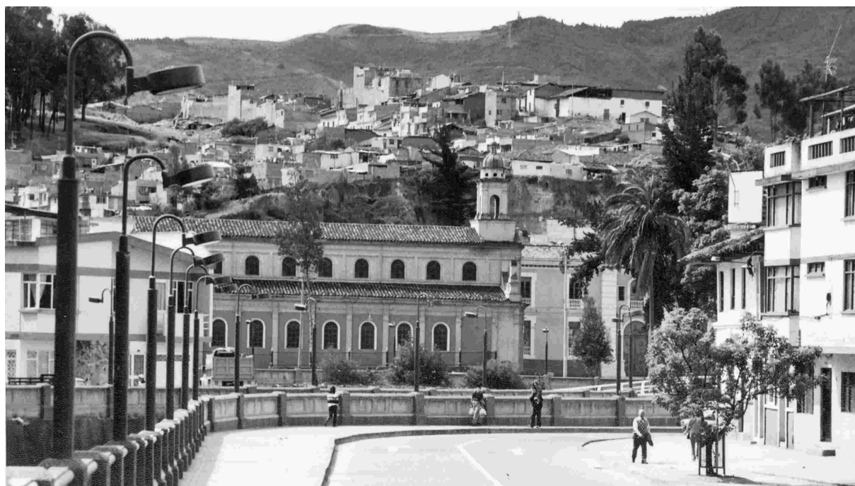
San Juan de Pasto

violentos; por ejemplo la reducción de costos hospitalarios para el municipio y los usuarios, años de vida ganados al bajar la tasa de homicidios y la mejora en el clima de confianza social. En este sentido resulta crucial informar a la ciudadanía sobre la importancia del tema, de forma que se legitime la inversión de recursos en programas de prevención y disminución de la criminalidad.