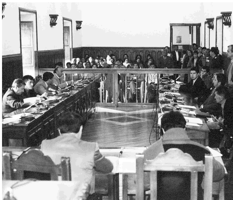
Sesión del Concejo Municipal de Pasto.

A principios de agosto saldrá a la luz pública el diagnóstico de las soluciones. El plan no es a corto plazo, ni sometido únicamente a la administración actual. Se espera que el próximo gobierno lo tome en cuenta y lo incluya en su plan de desarrollo municipal.