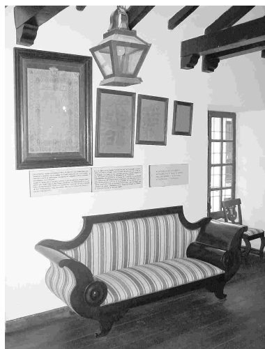
Salón de sesiones.