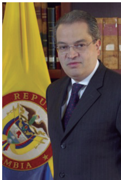
Fernando Carrillo, Ministro del interior.

Desde la independencia que corresponde a las ramas del poder público en Colombia, el Gobierno Nacional participa y apoya el ejercicio de la función legislativa que compete al Congreso de la República. Por su parte, la Corte Constitucional ejerce la tarea de control constitucional sobre las decisiones del legislador, estructurándose un esquema de pesos y contrapesos entre autoridades con el cual se procura el equilibrio institucional y la armonización de los intereses políticos de la sociedad.