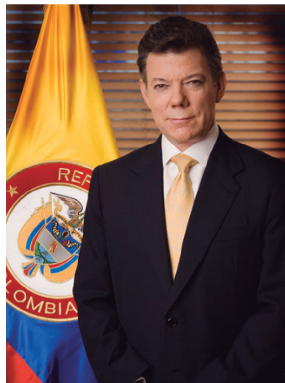
Juan Manuel Santos PRESIDENTE de la República de Colombia

Como en años anteriores, continúo disponiendo de este espacio en el periódico Nuevo Municipio para acercarme a los mandatarios locales.