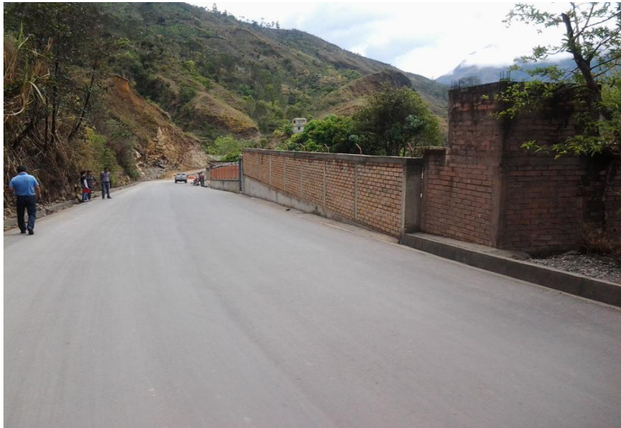
Pavimentación en asfalto y obras de restitución Sector San Pablo