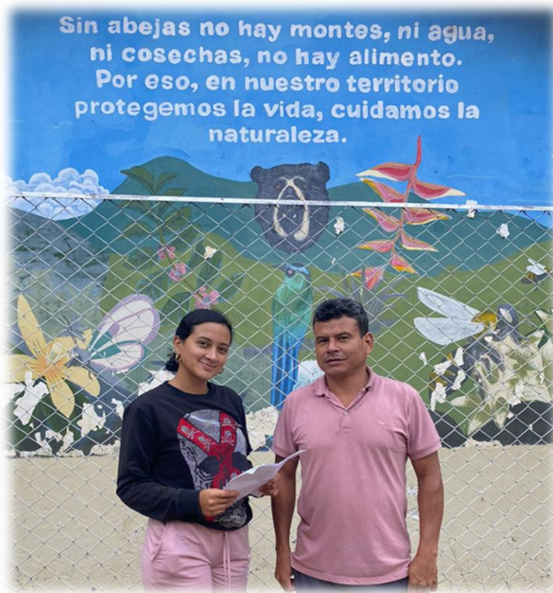
Figura 6. Fotografía entrevista líder de defensa del medio ambiente