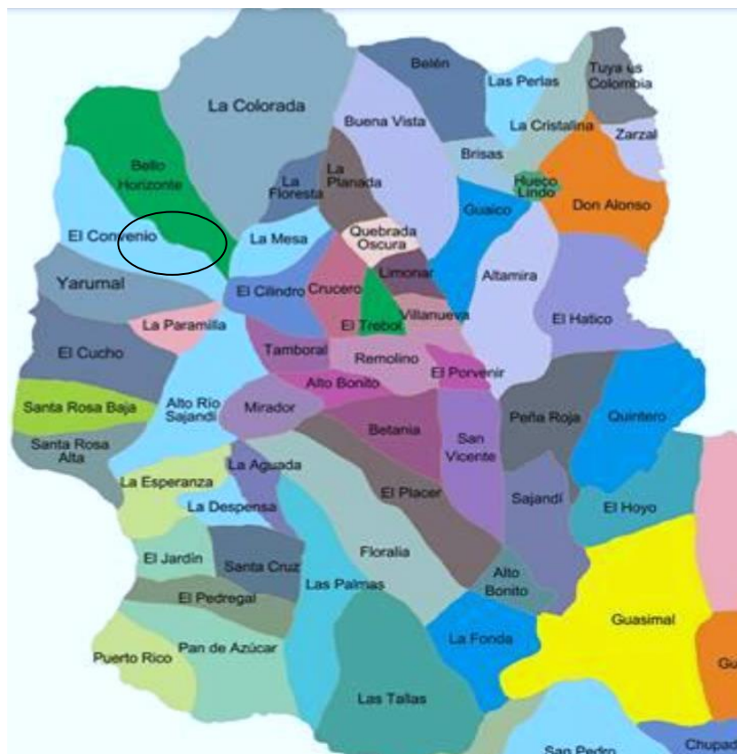
Figura 2. mapa de la Cordillera del Patía.

trabajo es más que todo familiar, el denominado jornaleo en fincas productoras ya sea de ganado, cultivos de limón, sandía, arroz, mango entre otros productos de clima cálido, más arriba de la fonda Patia las montañas de la cordilleras son inundadas de cultivos de hoja de coca dentro de estos cultivos una que otra mata de plátano, yuca, limón y maíz realmente de esto se basa la economía. En cuanto a las problemáticas del municipio se encuentra los elevados índices de población con insatisfechas necesidades, estructura vial en malas condiciones, en términos ecológicos el deterioro ambientales y de los recursos naturales debido al uso de químicos para cultivar, quema de grandes hectáreas de tierra para cultivar coca provocando la degradación de los suelos sumado a ello la baja productividad y producción agrícola. Esto se ha convertido en un reto para la administración municipal y la comunidad pues es una problemática que sigue avanzando y no se encuentra una solución que disminuya significativamente la degradación de los recursos.