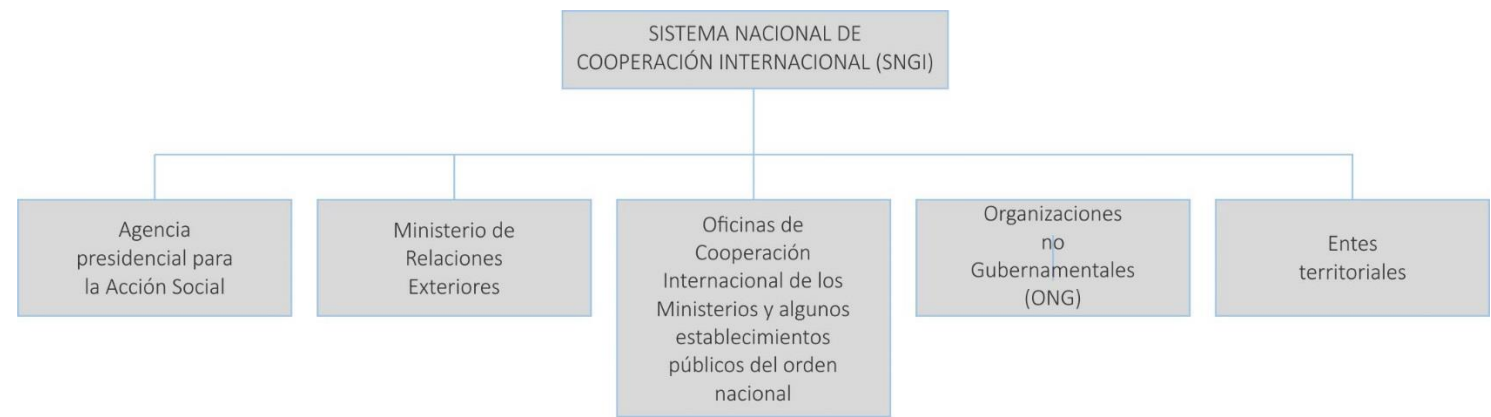
Figura 1. Cooperación internacional