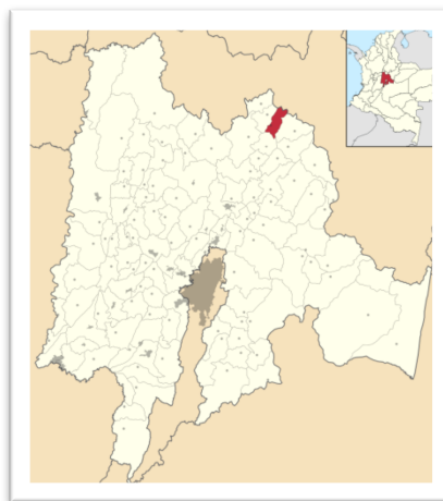
Imagen 1. Ubicación de Fúquene en Cundinamarca