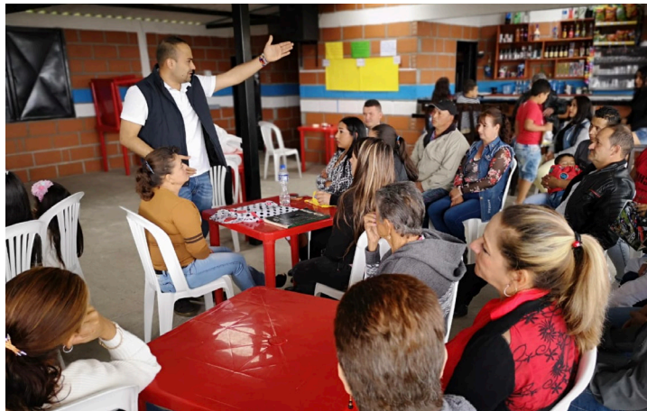
Foto 1. Taller Construcción colectiva programa de Gobierno Vereda Hojas Anchas

El enfoque metodológico para la construcción colectiva del programa de Gobierno “Supía productiva y educada” para el periodo de la alcaldía 2020-2023, fue la Planeación Participativa, haciendo uso de la técnica del Metaplan, para tal fin se realizaron en total 4 mesas de trabajo en la zona urbana y rural con el propósito de analizar con diferentes actores de la comunidad las principales problemáticas o tensiones que se identifican por en el municipio (Construcción árbol de problemas) y los principales proyectos que impactarían positivamente en el territorio.