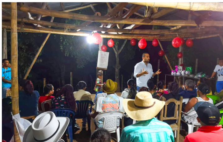
Foto 2. Taller Construcción colectiva programa de Gobierno Vereda Mudarra