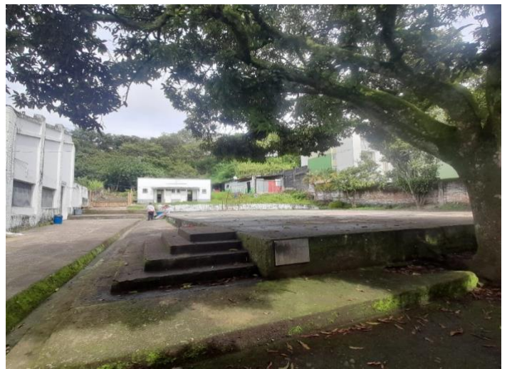
Espacio de recreación