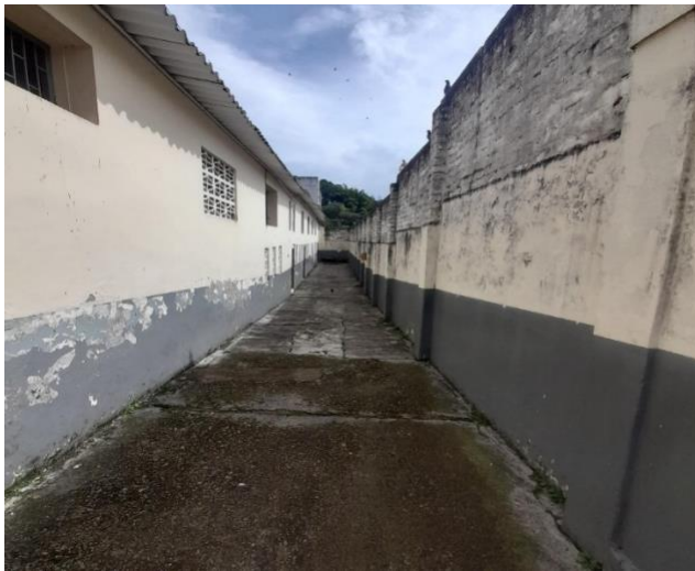
Ingreso a la escuela

Registro Fotográfico del estado físico Escuela Técnica San Pedro Alejandrino Sede 2 El Arado