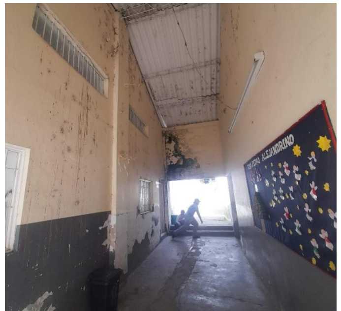
Fuente. Registro fotográfico de la infraestructura de la Escuela Técnica San Pedro Alejandrino Sede 2 El Arado Tomadas por la investigadora Maryuri Castro Naranjo