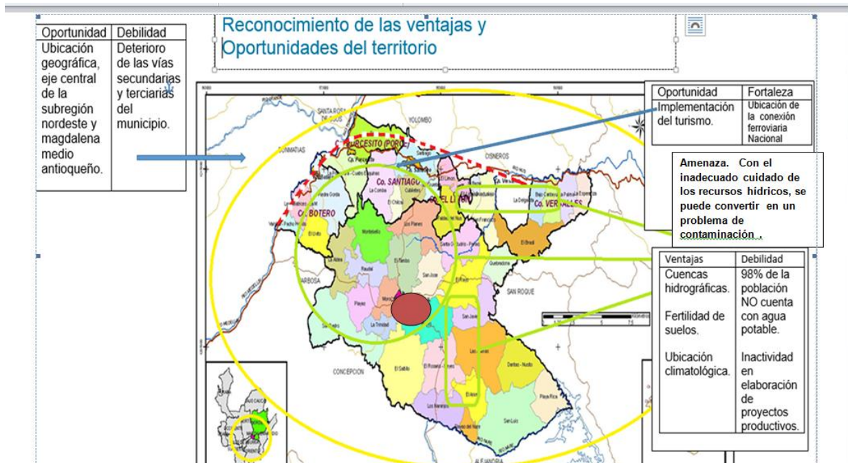
Ilustración 3 Mapa de Matriz DOFA del municipio

El municipio de Santo Domingo, cuenta con una ubicación y oportunidad estratégica para el desarrollo potencial de su economía, por estar ubicado en la zona limítrofe de la subregión oriente y nordeste antioqueño y sirviéndose como entrada al Magdalena medio. Limitando con los municipios de san Roque, Cisneros, Alejandría. Concepción, Yolombó, Don Matías, Santa Rosa y Barbosa.