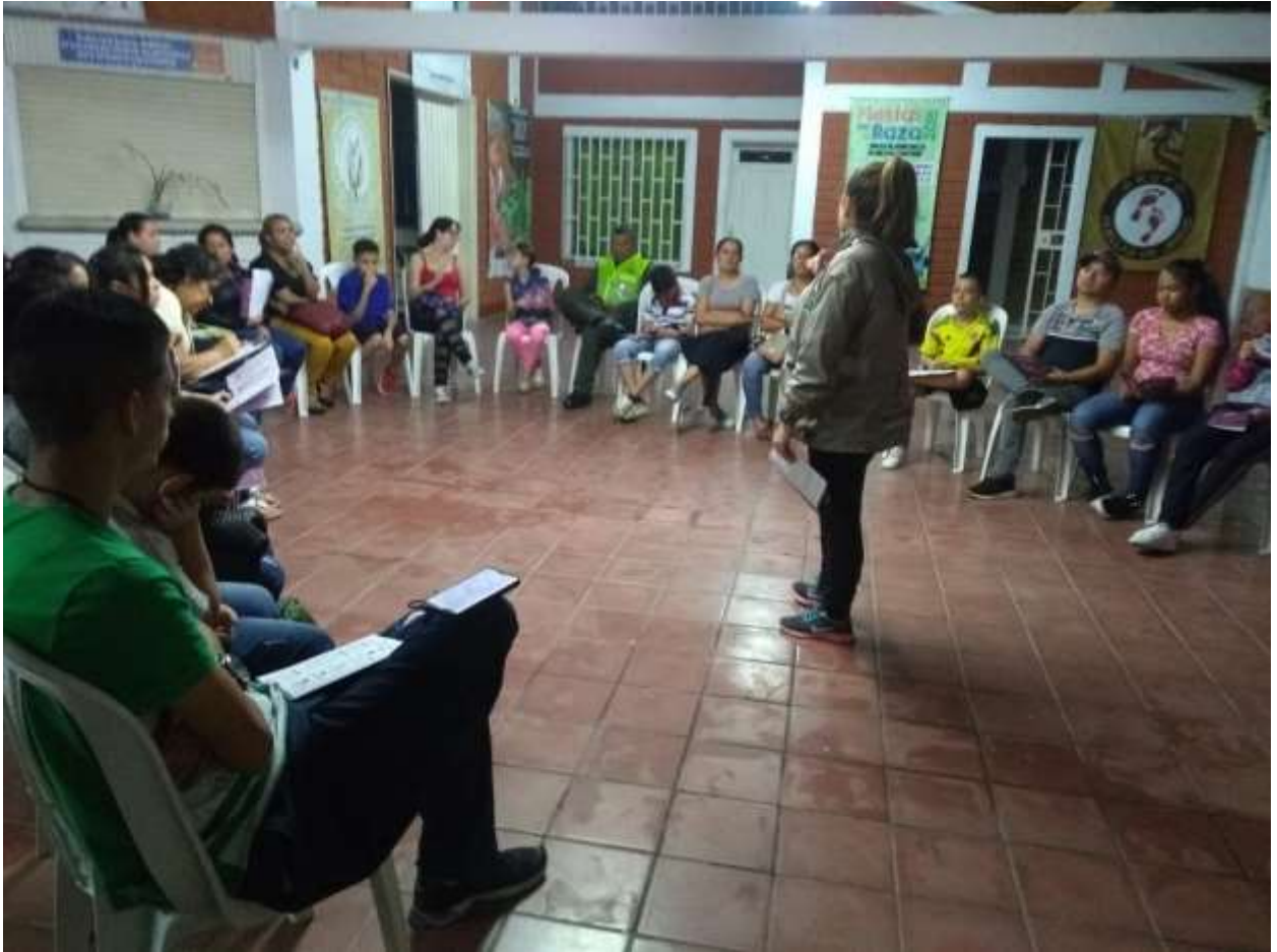
Figura 1: Reunión JAC Comuna 6 Doce de Octubre de Medellín y Comunidad.