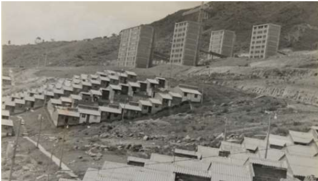
Figura 3: inicios de la urbanización del Barrio Doce de Octubre

La imagen muestra los inicios de la urbanización del Barrio Doce de Octubre, esta es la parte alta y como se aprecia todo está por hacer, lo que implica la demanda de muchos esfuerzos de la comunidad para mejorar su hábitat; esto hace que instituciones como la JAC sean muy importante y necesarias para moldear el barrio.