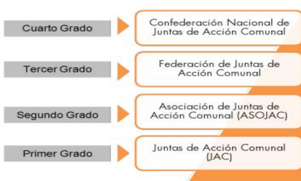
Grafico 1. Estructura organizacional de la acción comunal

principios, fundamentos y objetivos consagrados en esta ley y las normas que le sucedan y reglamenten” (Ley 2166 del 18 Diciembre de 2021 por la cual se deroga la Ley 743 de 2002, Art 6).