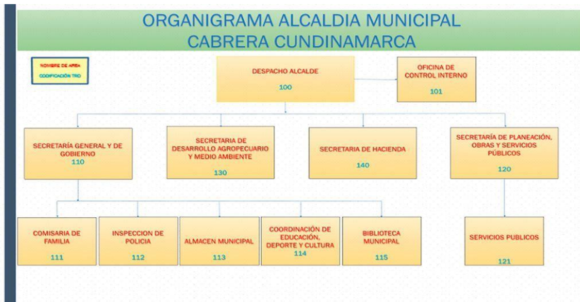
Ilustración 5. Organigrama alcaldía de Cabrera