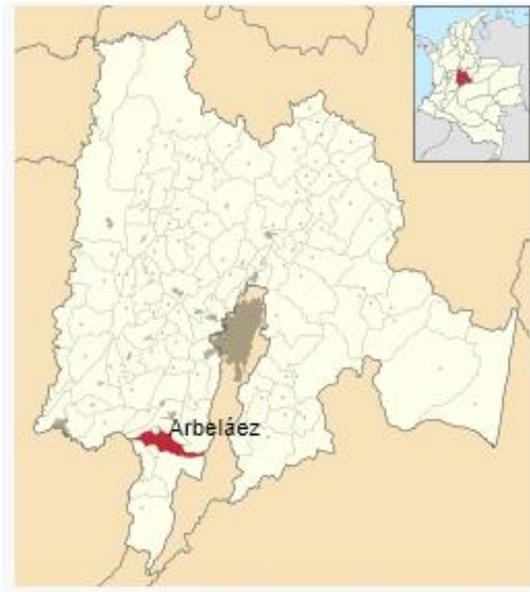
Ilustración 1 Localización de Arbeláez en el departamento de Cundinamarca