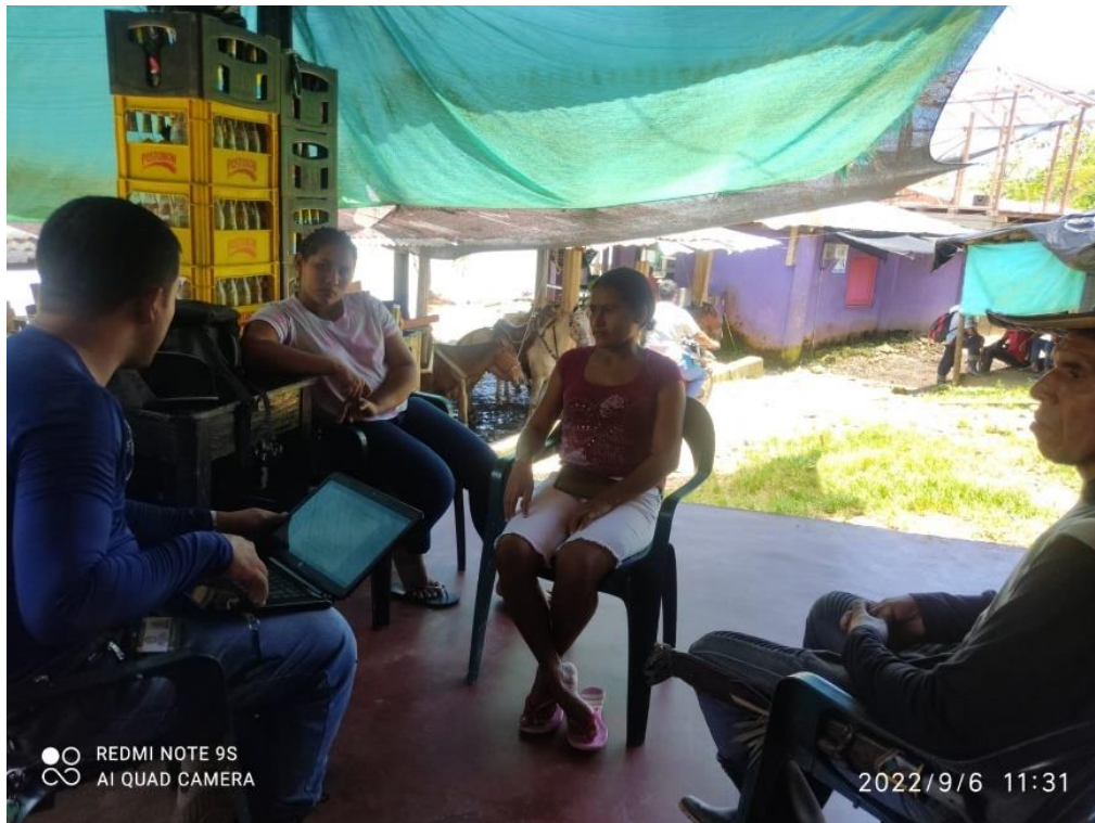
Ilustración 4. Capacitación a la Vereda El nevado