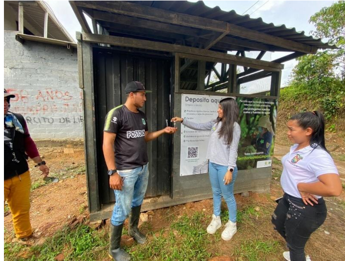
Ilustración 12. Entrega de un centro de acopio de reciclaje para el corregimiento de Raudal.