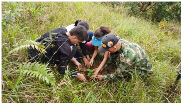
Ilustración 9, Siembra de árboles

que el cambio climático los ha afectado, por tal razón buscan la manera de preservar sus productos agrícolas, esto hace que las personas se interesen más por conservar y preservar el medio ambiente. La estrategia utilizada dentro de esta comunidad es la capacitación en la preservación de los arboles y cuidado de los subsuelos, para que el entorno en donde se encuentran pueda ser fértil.