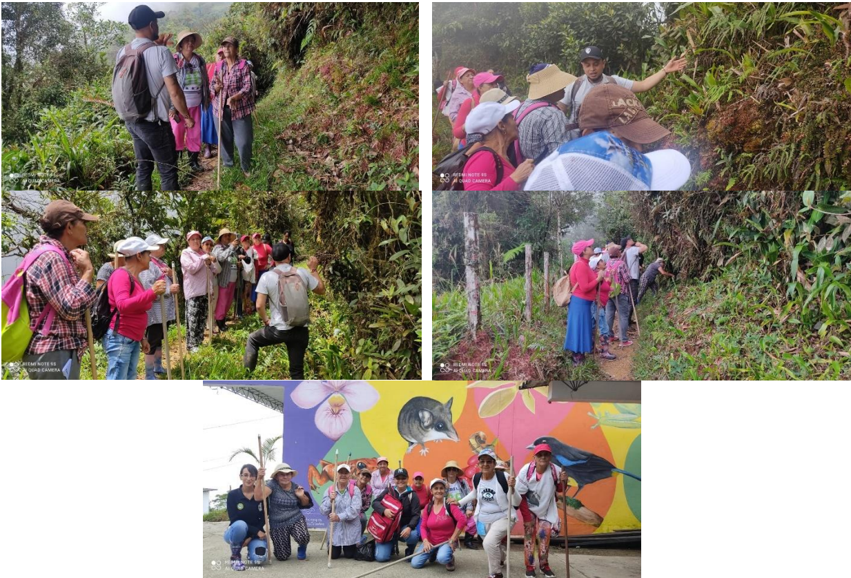
Ilustración 2. Caminatas con grupos de la tercera edad