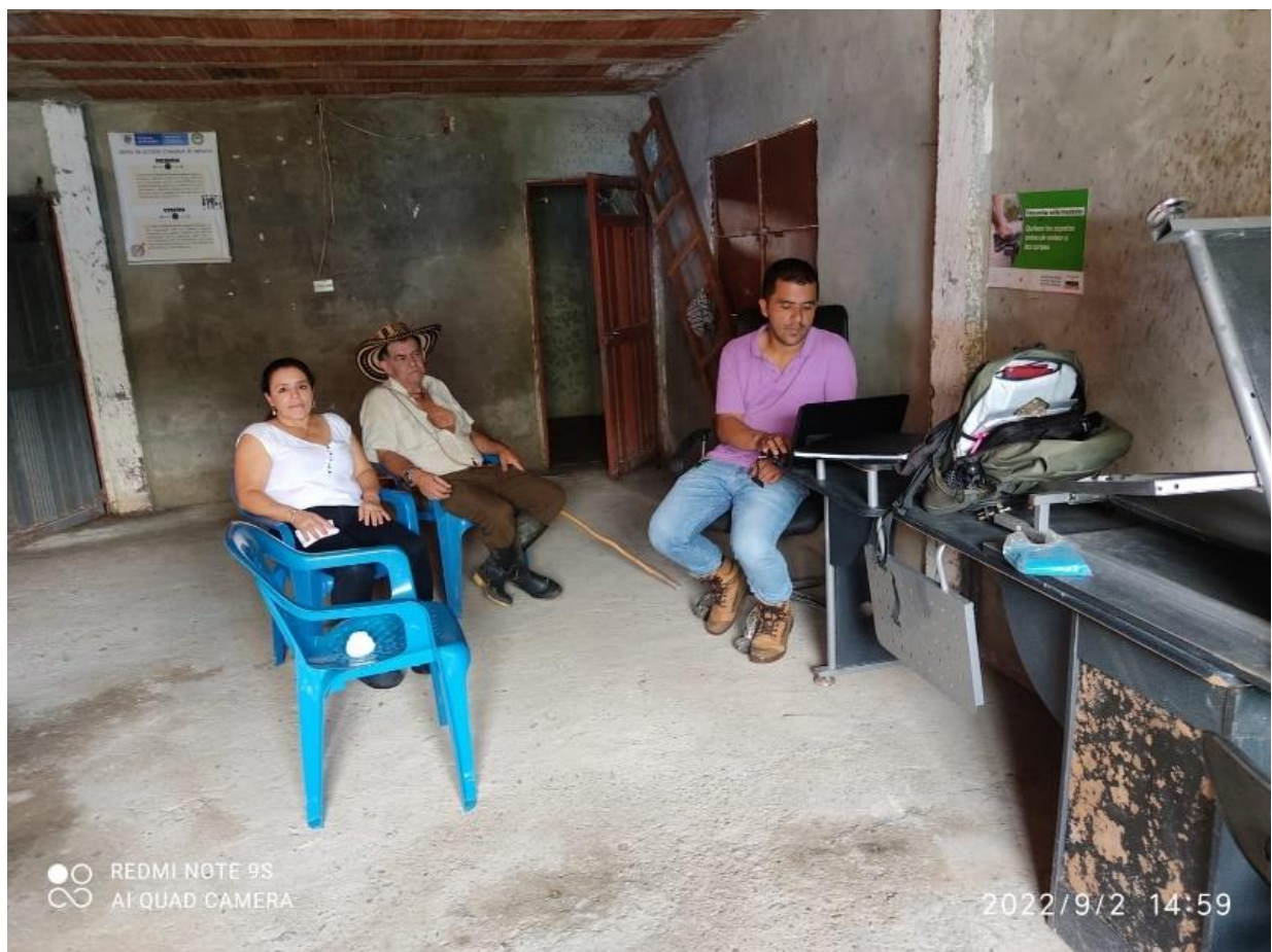
Ilustración 3. Capacitación en la Vereda La coposa