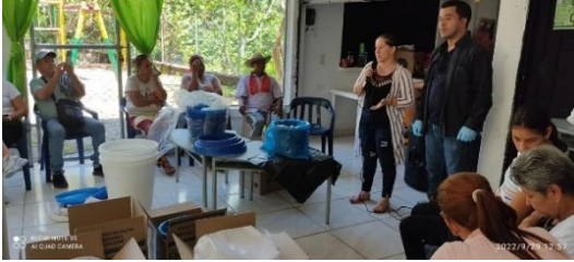
Ilustración 7. Capacitación sobre uso del filtro de agua