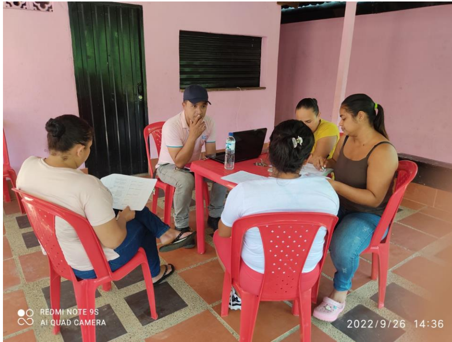
Ilustración 6. Capacitación en la Vereda la habana