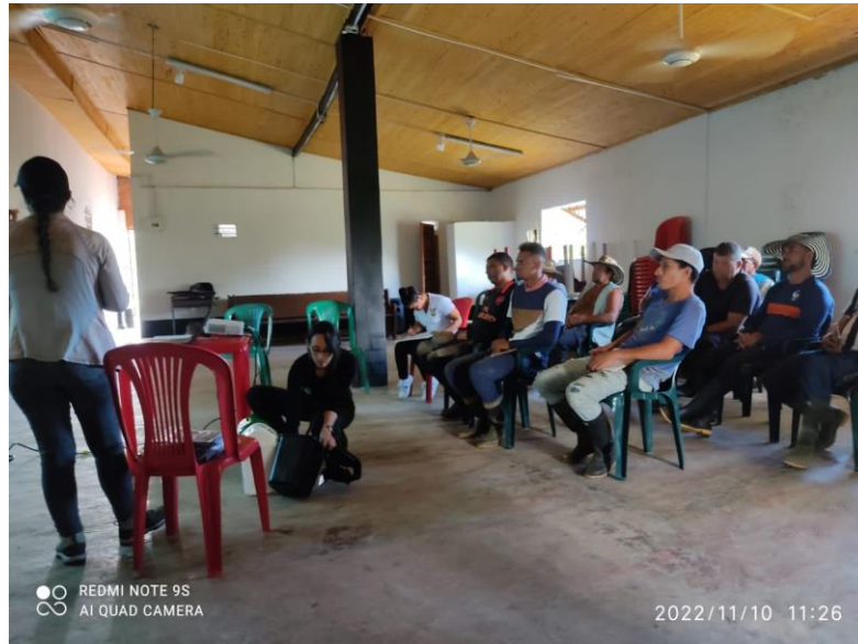
Ilustración 10. Capacitación en temas de reciclaje, código de colores y aprovechamiento de residuos orgánicos