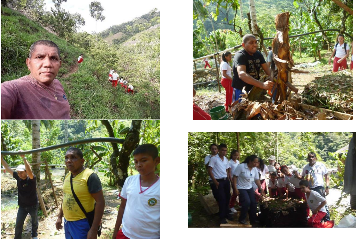
Ilustración 1. Salida pedagógica de la Institución Educativa