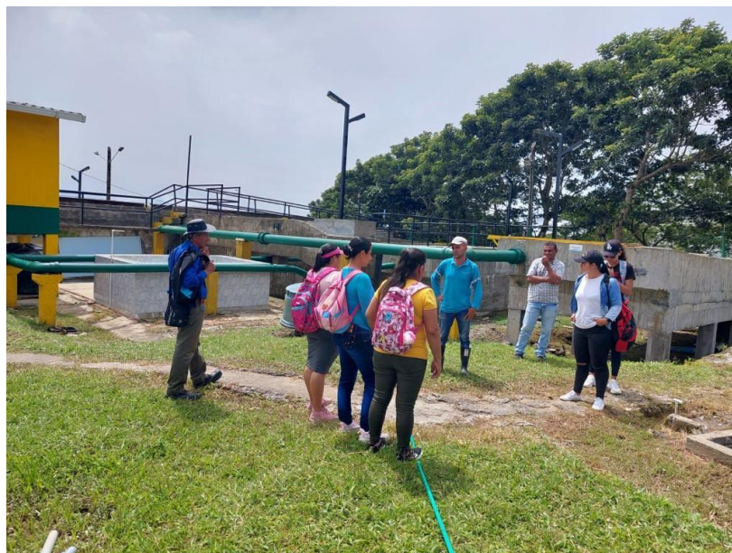
Ilustración 11. Visita a la PTAP del municipio, en el marco del programa de uso eficiente y ahorro del agua