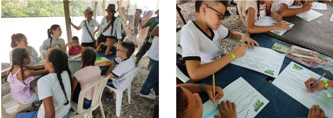
Ilustración 8. taller en reconocimiento a la nutria de mar