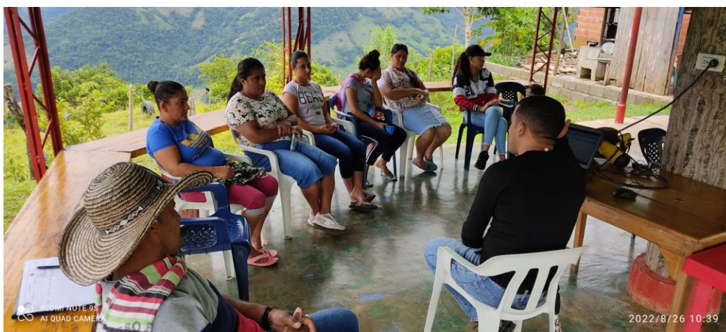
Ilustración 5. Capacitación en la Vereda remolinos