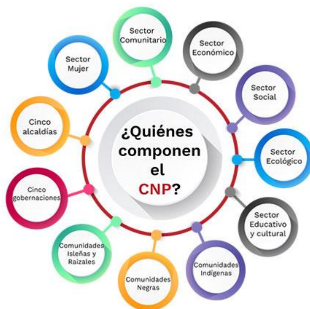
1 Sectores del CNP

Hacen parte del consejo nacional de planeación 9 entidades territoriales que son: