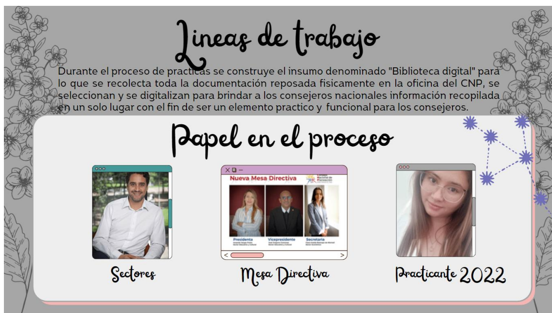
Ilustración 5 líneas de trabajo coworking - Elaboración propia

Durante esta fase se lleva a cabo el 9° coworking un espacio creado por el Departamento Nacional de Planeación para que todos los estudiantes vinculados en la realización de sus practicas hagan la presentación del proyecto desarrollado partiendo desde la oportunidad de crecimiento y generación de proyectos desde una vista fresca hacia la creación de un insumo, orientado hacia el análisis y el desarrollo practicas efectivas y productivas en pro de la aplicación de instrumentos adquiridos durante en el proceso de construcción educativa, demostrando así el dominio de instrumentos profesionales, en este espacio se realiza la presentación del proyecto denominado “EMPALME” 1 en donde se presenta la oportunidad de creación de un insumo vital para el proceso de transferencia de cargos y la condensación de documentos que aportaría a este proceso.