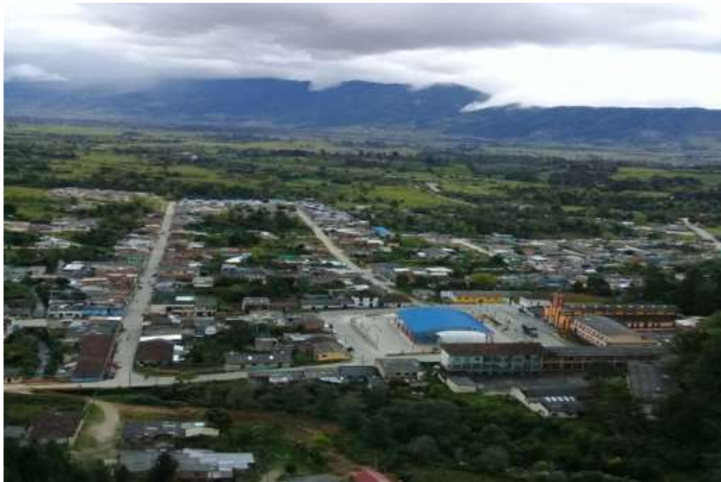
Figura 1. Panorámica de Santiago Putumayo, Puerta a la Amazonia Colombiana.