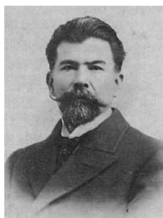
Benjamín Herrera Cortés. Fundador de la Universidad Libre