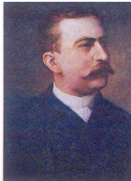
Benjamín Herrera Cortés. Fundador de la Universidad Libre

enseñanza oficial. Los liberales que habían acompañado a Núñez y que se distanciaron de la política oficial fundaron el conocido Movimiento Independentista .