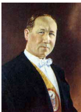
Enrique Olaya Herrera. Presidente de Colombia (1930-1934). Estudiante de la Universidad republicana