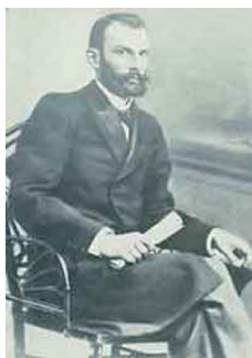
Rafael Uribe Uribe. Promotor y profesor de la Universidad Laica