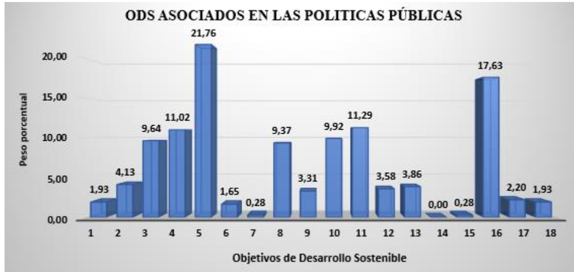
Figura 2. Articulación de los ODS en las Políticas Públicas Distritales 2018 – 2020