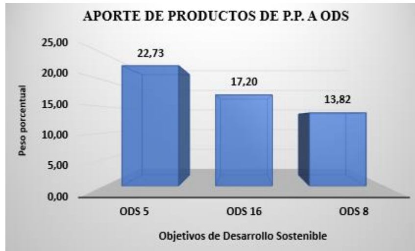
Figura 3. Aporte de productos de las Políticas Públicas a ODS.