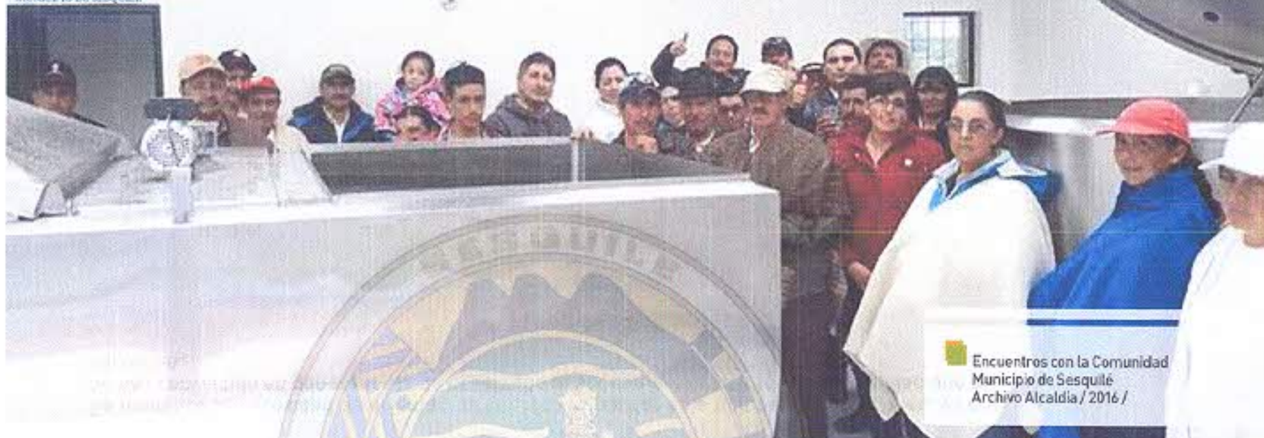
Tabla 114 / Representantes de Asociaciones y Cooperativas