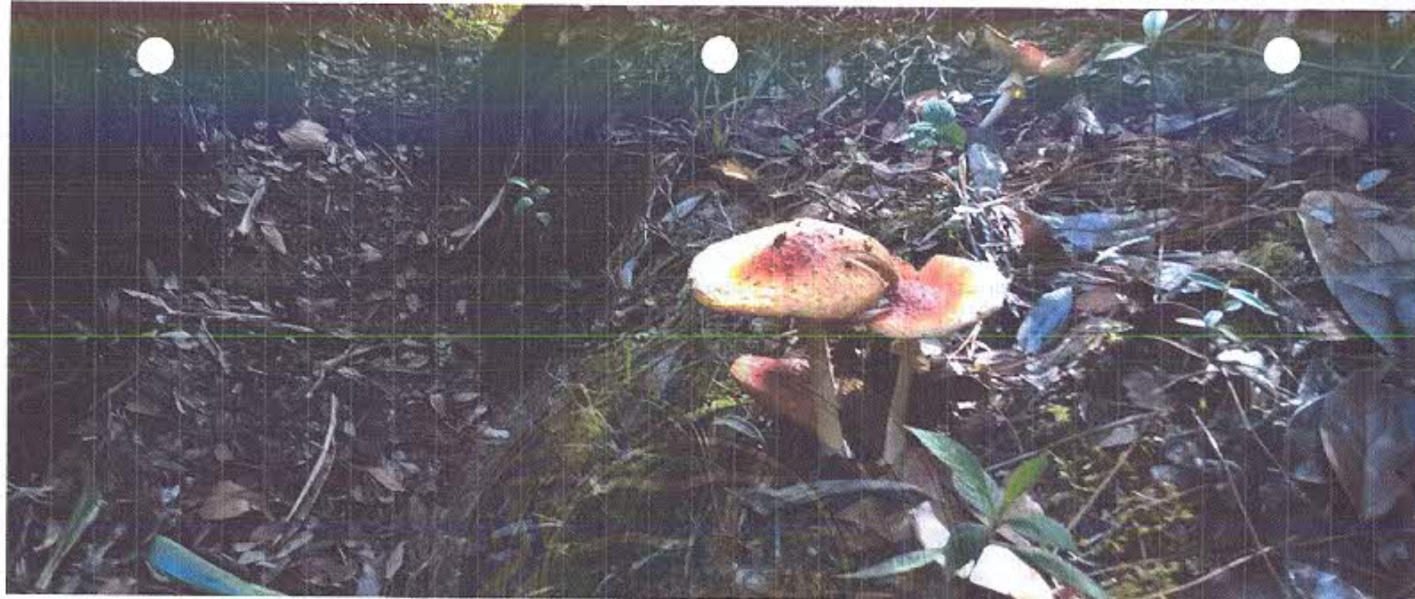
Tabla 119 / Aportes del diagnóstico para la construcción de la visión del municipio