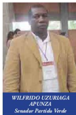
WILFRIDO UZURIAGA APUNZA Senador Partido Verde

“El Estado debe ser eficiente y al servicio de la comunidad. Las políticas públicas deben ser permanentes, sin importar la corriente o el partido, los desarrollos deben mantenerse en el tiempo. La autonomía regional debe ser y debe cambiar. La descentralización debe darse, pero con autonomía; pero también se deben generar cambios dentro de las regiones, ejercer una Administración Pública con honestidad y con servicio al pueblo. La gente debe participar y debe definir sus prioridades y que sea la voluntad del pueblo que diga lo que necesita”.