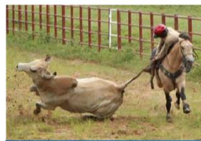
El coleo, deporte insignia de los llaneros

En época de verano (diciembre-marzo) se recomienda a los turistas visitar las trincheras de Corosopando ubicada en el suroriente del casco urbano. Así como las calles empedradas y las viejas casonas del pueblo. Las cárceles construidas por los españoles en la época de la Inquisición que quedan frente al Parque Santander.