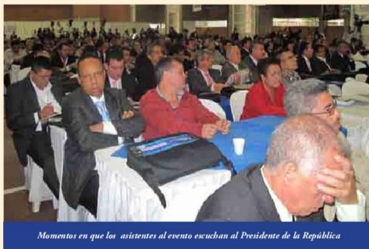
Momentos en que los asistentes al evento escuchan al Presidente de la República

Finalmente, les pidió que trabajaran con visión, que buscarán la certificación de calidad para sus Alcaldías y Gobernaciones, el mejoramiento de la calificación de las contralorías y que apoyaran al mandatario entrante de los colombianos.