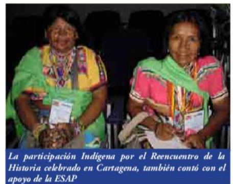
La participación indígena por el Reencuentro de la Historia celebrado en Cartagena, también contó con el apoyo de la ESAP