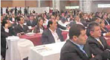
Interesados por los diferentes temas de actualidad se mostraron los congresistas y sus asesores en el evento de capacitación.

Con un entorno político candente por la demanda de la ex secuestrada Ingrid Betancur contra el Estado colombiano y por la no entrega de las credenciales electorales a los congresistas electos por parte del Consejo Electoral a sólo 4 días de su posesión; se llevó a cabo el Seminario de Actualización en Administración Pública para nuevos congresistas por parte de la ESAP.