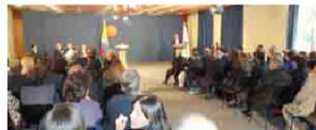
Momentos del evento protocolario en el Salón Bolívar de la Casa de Nariño, el pasado 27 de mayo.

Así mismo, finalizó destacando cómo conquistó las más altas dignidades de su partido, y cómo estudió y propuso fórmulas de solución para enfrentar los grandes problemas de la sociedad y el Estado