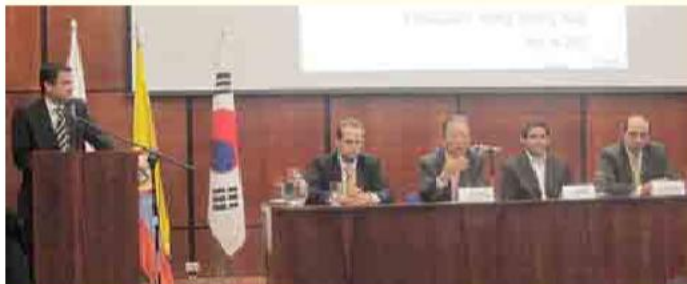
En el auditorio Camilo Torres de la ESAP su excelencia Seang-Hoa-Hong embajador de Colombia en Corea habló de la importancia de las relaciones bilaterales y del tratado de libre comercio con Colombia.