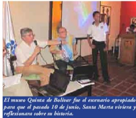
El museo Quinta de Bolívar fue el escenario apropiado para que el pasado 10 de junio, Santa Marta viviera y reflexionara sobre su historia.