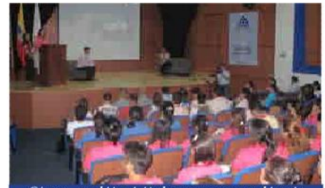
Cúcuta, también vivió el encuentro con su historia.

Francés y la Independencia de Colombia"; el Foro: "La Independencia obra de Todos: Estados Unidos, Haití y descendientes de africanos en la Independencia de Colombia" y el Congreso Colombiano de Historia.