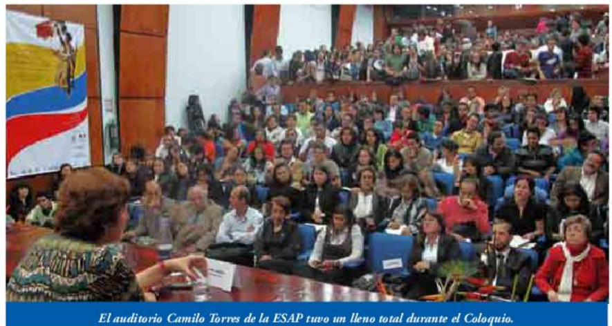
El auditorio Camilo Torres de la ESAP tuvo un lleno total durante el Coloquio.

El Coloquio se constituyó en un escenario especialmente pensado para el encuentro con las ideas y con la razón, con las corrientes del pensamiento francés de los siglos XVII y XVIII, cuya incidencia fue definitiva para escribir la independencia de nuestro país, que desde entonces, son inspiradoras de una nación a la que le ha sido permitido configurar y moldear sus instituciones públicas en un marco de respeto por el estado de derecho, la libertad y el orden.