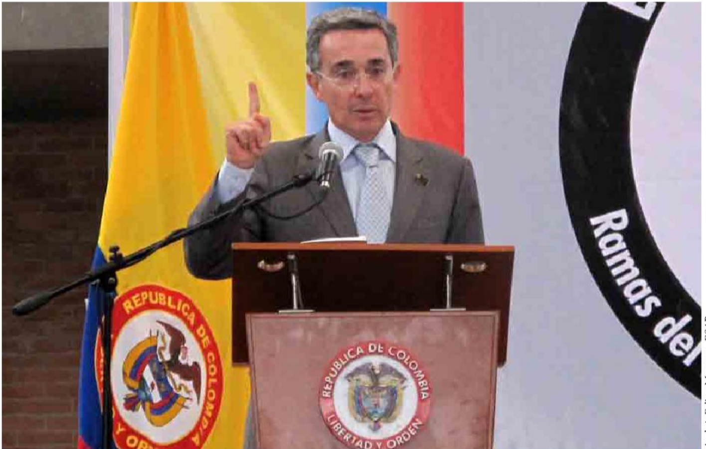
El presidente de la República, Álvaro Uribe Vélez, invita a todos los colombianos a meditar sobre los 200 años de independencia del país.