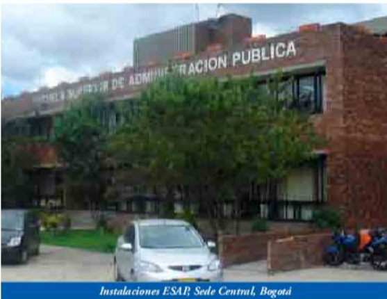
Instalaciones ESAP, Sede Central, Bogotá

Subdirector Administrativo y Financiero de la ESAP