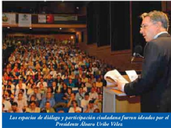
Los espacios de diálogo y participación ciudadana fueron ideados por el Presidente Álvaro Uribe Vélez

Durante estos años, los consejos comunales de gobierno han demostrado ser una herramienta de gestión pública efectiva. En palabras del Presidente Uribe, "el diálogo comunitario exige un gran