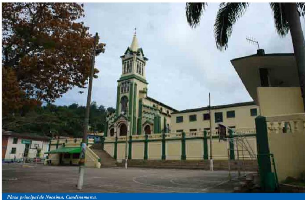
Plaza principal de Nocaima, Cundinamarca.