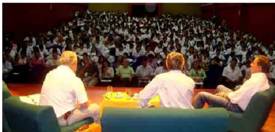
La asistencia fue masiva en el auditorio del Instituto de Cultura del Meta.

La ESAP convoca la realización de cinco Encuentros Regionales a realizar en las ciudades de Villavicencio (4 de marzo); Leticia (21 de abril); Cartagena (20 y 21 de mayo), este último en el marco de las Actividades del SAIL Cartagena y la Feria Marítima Internacional que organiza la Vicepresidencia de la República y la Dirección General Marítima; Santa Marta, 10 de junio; y Cúcuta, 7 de julio.