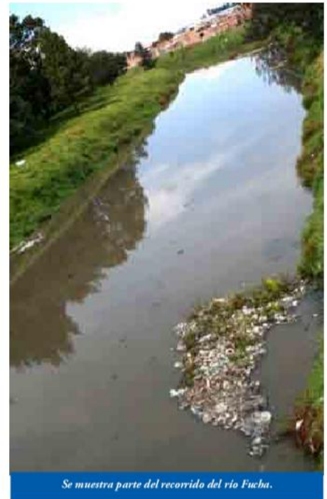
Se muestra parte del recorrido del río Fucha.

La contaminación del río Bogotá, considerado el problema ambiental más complejo del país, requiere para su solución, asegurar 1.5 billones de pesos más de presupuesto, así lo dio a conocer el Contralor General de la Nación, Julio César Turbay Quintero, al presentar el informe de auditoría especial a la gestión del río Bogotá.