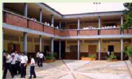
El proceso de inversión en educación formal ascendió a $46.435 millones en 2009

Ministerio de Educación Nacional, promoción, inversión, Sector Solidario, Educación.