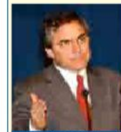
Diego Valencia, Ministro de la Protección Social

Las EPS e IPS que recibieron estos giros fueron las que presentaron la información completa.