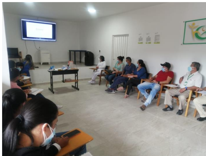
Capacitación realizada a los funcionarios de la IPS primer nivel de atención.

Se realiza capacitación a funcionarios de la administración municipal y de la IPS Hospital Integrado Santa Ana de Guaca en la normatividad vigente del derecho a la salud, los mecanismos de participación social.