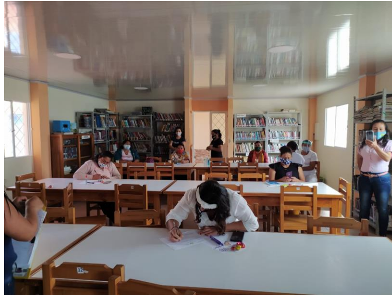
Capacitación a funcionarios de la administración municipal realizada en la biblioteca pública.