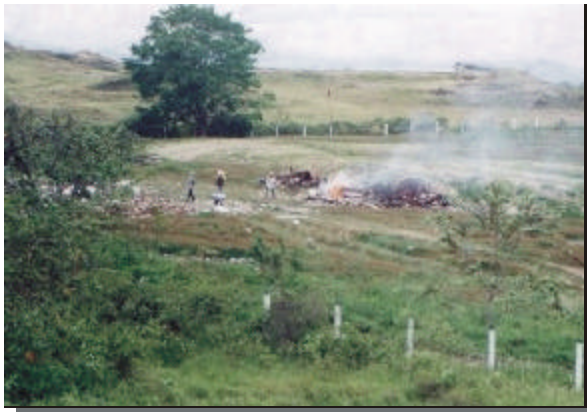
Sitio utilizado para la disposición final de residuos sólidos generados en el municipio.

En la zona rural , solamente los centros rurales de San Agustín y Santa Inés cuentan con instalación de red de alcantarillado en tubería de cemento con diámetros de 12, 14 y 16 Pulg. Efectuando las descargas directamente al río Saldaña sin ningún tipo de tratamiento. En el asentamiento de Santa Inés se terminó en un 100% la instalación de la red de alcantarillado, sin embargo aún no se encuentra en funcionamiento debido a la falta de construcción de una trampa de grasas. Estos alcantarillados no poseen dispositivos para el tratamiento de las aguas servidas.