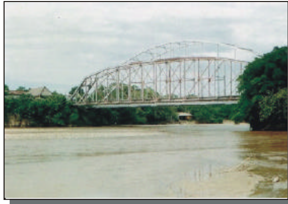
Panorámica del puente Ospina Pérez sobre el río Saldaña.