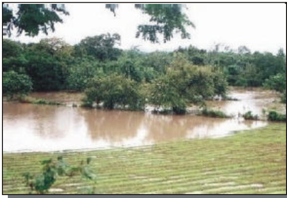
Áreas de cultivos afectadas por inundaciones del río Saldaña.

Las evaluaciones geológicas e hidrológicas realizadas a través del reconocimiento fotogeológico y la visita de campo, así como el análisis de la información existente y entrevistas con habitantes del municipio permitieron determinar que el territorio de Saldaña tiene áreas expuestas a amenaza por inundación del río Saldaña y la quebrada Papagalá. No se puede precisar con certeza si el municipio tiene amenaza por el Volcán Cerro Machín, por ello, una vez INGEOMINAS publique el Mapa de Amenaza Volcánica del Volcán Cerro Machín, sus resultados deberán ser utilizados para actualizar el Esquema de Ordenamiento Territorial. Adicionalmente todo el territorio municipal de Saldaña tiene una amenaza sísmica intermedia.