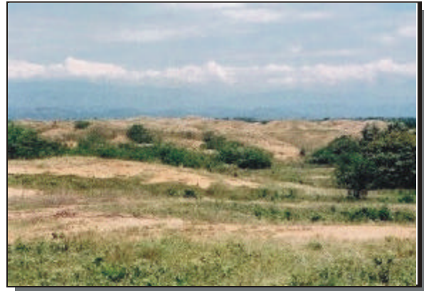
Panorámica de procesos de erosión severa que se manifiestan en suelos de la vereda Jabalcón.

unidades de mayor aprovechamiento en actividades agropecuarias.