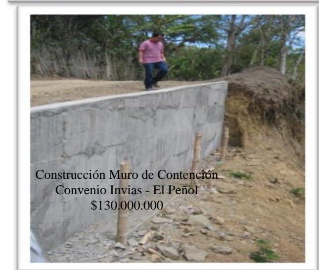
Construcción Muro de Contención Convenio Invias - El Peñol $130.000.000

“POR UN CAMBIO SOCIAL, DE PROPUESTAS Y OPORTUNIDAD PARA TODOS”