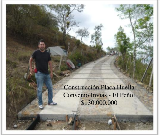
Construcción Placa Huella Convenio Invias - El Peñol $130.000.000