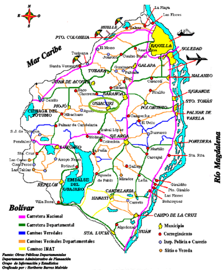
Mapa Vial del Departamento