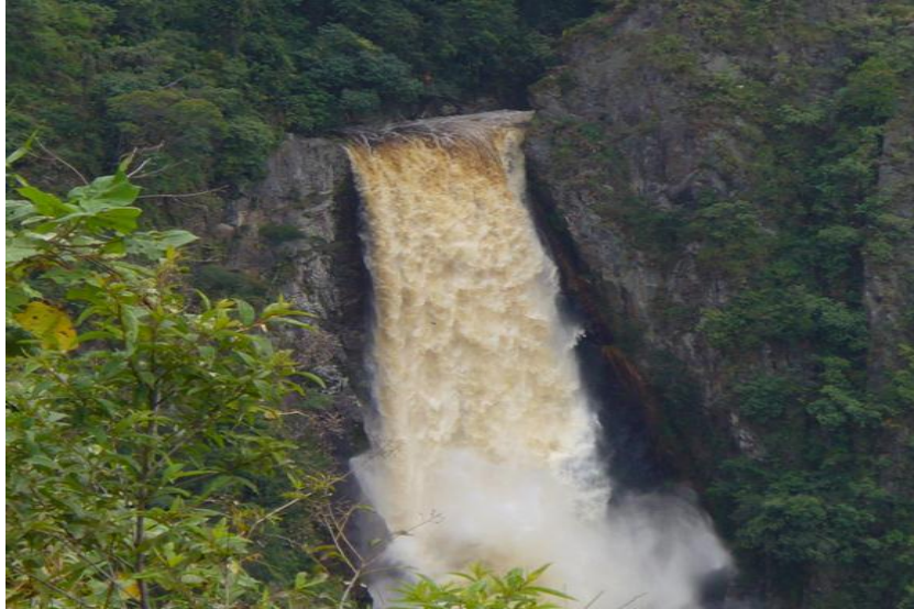
Figura 1. Primera caída, Salto de Bordonos