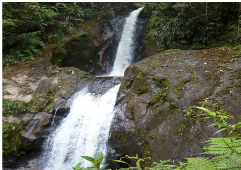
Figura 2. Tercera caída Arco de las Jarras

Sobre la quebrada de la Linda, cerca al río Bordonos. Vereda del Arco, se halla varias figuras que semejan la figura de una jarra, razón que le ha dado el nombre; dista 6 Km del Salto de Bordonos con carretera hasta la escuela y de ahí en camino de herradura hasta el sitio.