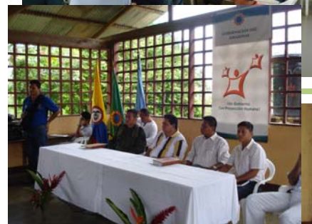
Mesas de trabajo en conjunto con la Gobernación del Amazonas.